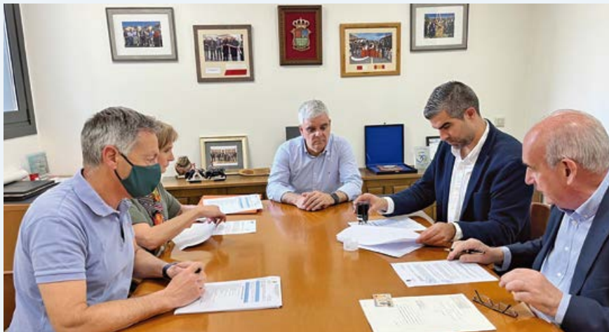
Firma del contrato de adquisición con Ureta Motor

Ayuntamiento y Ureta Motor S.A. han firmado el contrato para la adquisición del camión de obras que sustituya al anterior, obsoleto por el paso del tiempo y las continuas averías que su deterioro estaba produciendo prácticamente a diario.