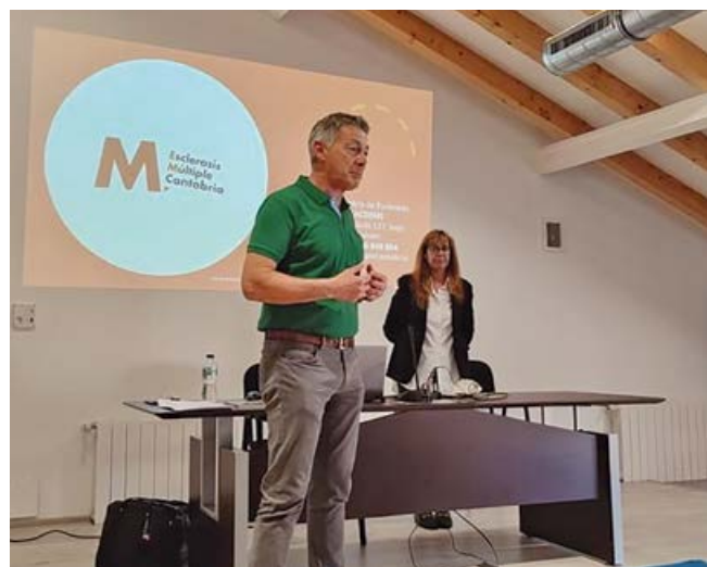
Conferencia en la Casa de los Camineros

Desde la sección de deportes de Campoo de Enmedio se realizan anualmente varias colaboraciones de este tipo