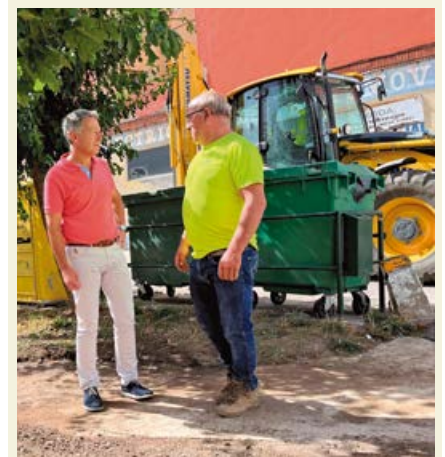
Instalación de nuevos hidrantes

Así mismo, el estudio ha tenido en cuenta la situación geográfica de cada pueblo, habitantes, servicio, instalaciones, masas forestales etc.