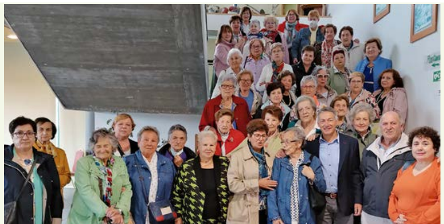
Participantes en el encuentro

Como en años anteriores, la asociación de viudas La Esperanza, de Matamorosa, organizó un encuentro con diversas asociaciones para celebrar el "Día de la Viuda" y reivindicar así los derechos de este colectivo. Al acto acudieron representantes de la asociación nacional y varios colectivos de