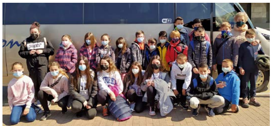
Participantes en el campamento de Arroyo

Veintitrés niños pertenecientes al municipio de Campoo de Enmedio han participado en el campamento de Semana Santa organizado por el Ayuntamiento entre el 18 y el 23 de abril. Los jóvenes, con edades comprendidas entre los 9 y los 14 años, han disfrutado de múltiples actividades en el albergue Cantabria Aventura, ubicado en la localidad de Arroyo. Los participantes disfrutaron de varios talleres medioambientales y de cocina, así como de multitud de actividades, juegos de aventura y gymkanas, canoas en el embalse del Ebro, paintball indoloro, rocódromo, camas elásticas,