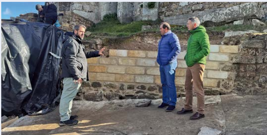
Visita a la restauración del muro del foro