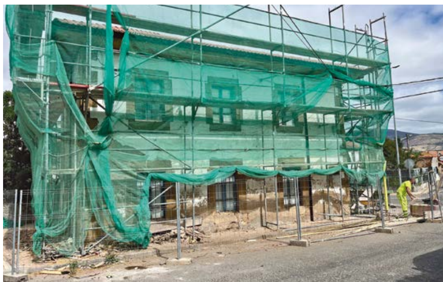
En la primera fase se rehabilitó el tejado y el interior de la planta baja

Inicialmente se ha procedido al vaciado del edificio, incluyendo tabiquerías y todo tipo de servicios, sanitarios, radiadores, tuberías etc. Mediante medios manuales se ha retirado la cubierta del tejado, cambiando las viguetillas que se encontraban en mal estado y colocando tablero hidrófugo con capa aislante, manta impermeable y teja mixta cerámica, actuando en toda la superficie de la cubierta y rematando