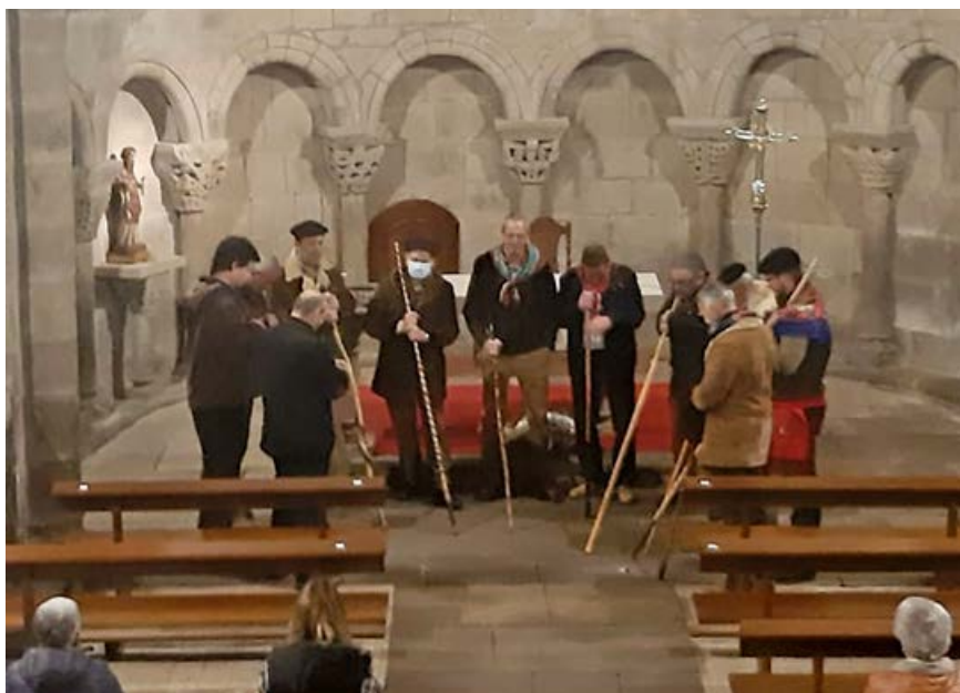
El Ligerucu en la Colegiata de Cervatos