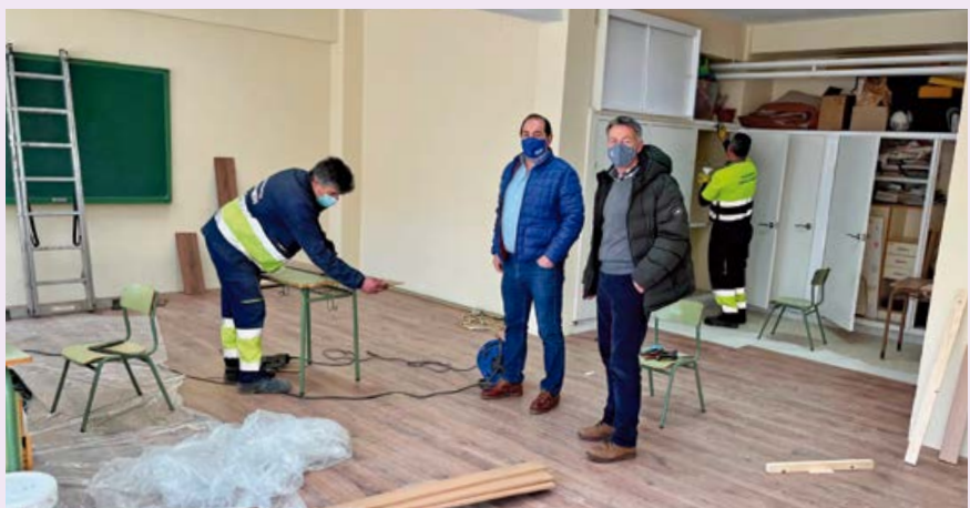
El ayuntamiento rehabilitó los locales de la ludoteca

Los trabajos han consistido en el desmontaje de la totalidad del local, retirada de escombros, persianas y mobiliario para proceder a la adecuación de paredes para su pintado. Se ha instalado un nuevo