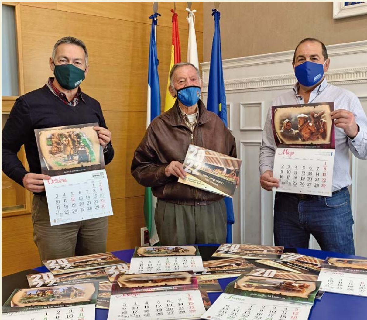
Presentación del calendario 2022