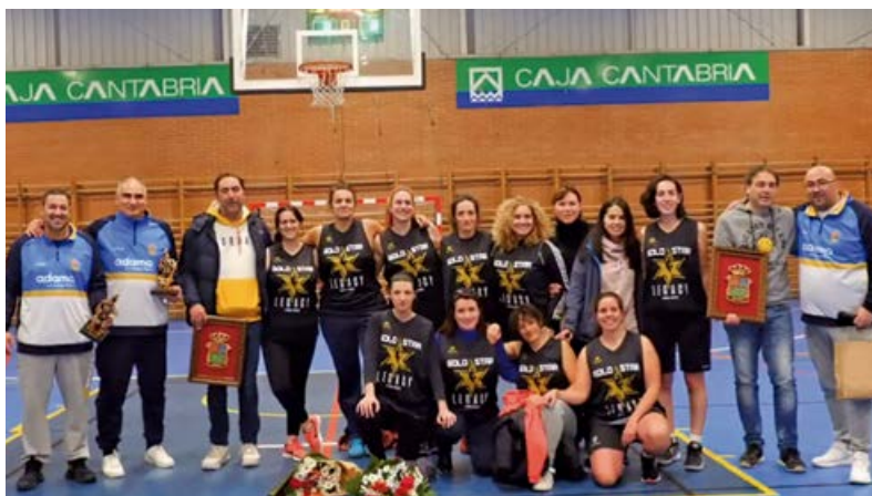
Participantes en la jornada