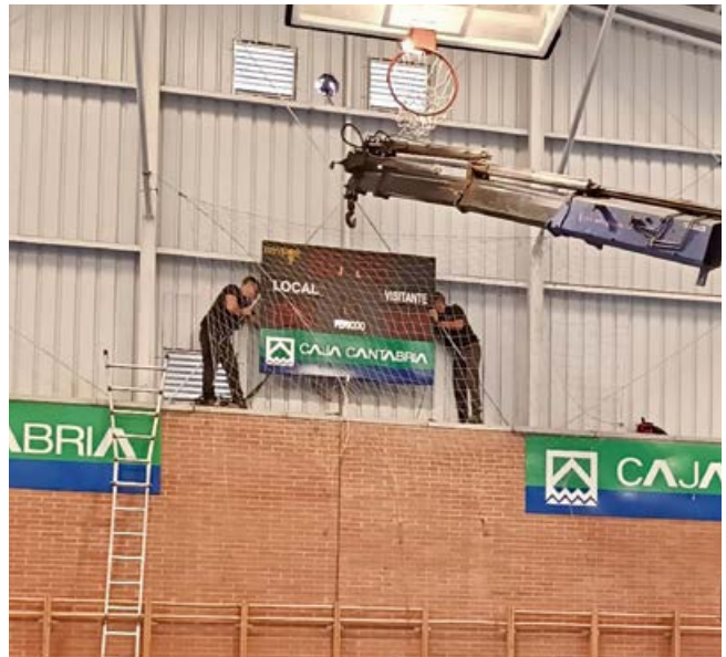
Instalación de nuevo marcador en el polideportivo