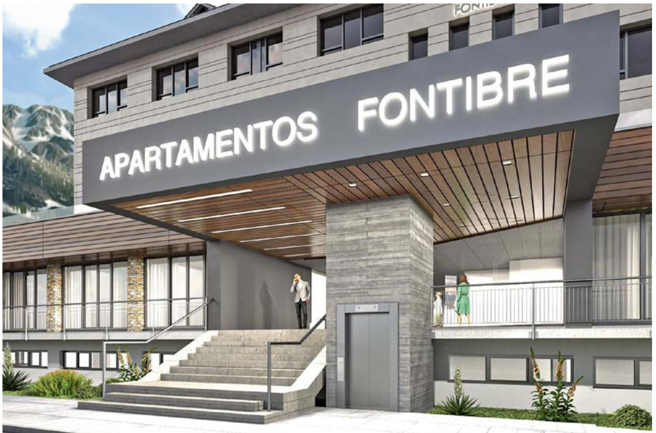
Detalle de los accesos

En noviembre del 2008, se inaugura en Matamorosa, el Área de Servicio la Vega, en el polígono de la Vega, buque insignia de la familia y del que se sienten especialmente orgullosos. El trabajo dedicado al área ha dado sus frutos consiguiendo que sea un referente, no sin mucho esfuerzo e implicación por parte no sólo de la gerencia sino también de sus empleados, una plantilla formada por gente de la comarca, joven y con muchas ganas de trabajar.