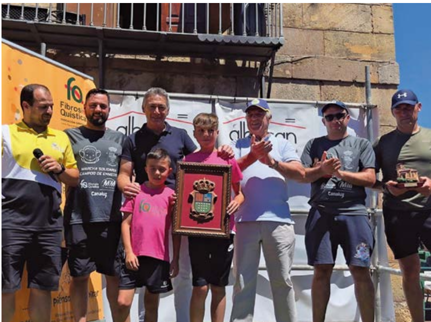
Entrega de reconocimientos de la marcha solidaria