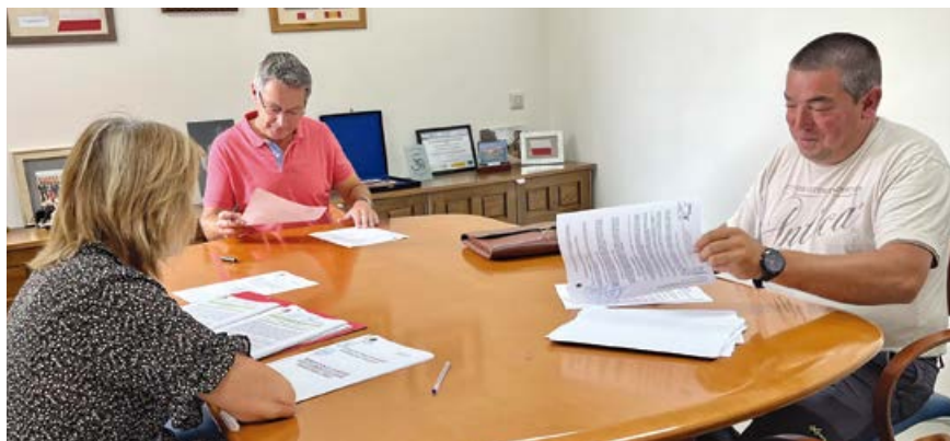
Firma del contrato con la empresa Rozaver

Hace año y medio se ejecutó la obra de renovación de la red de abastecimiento en la parte izquierda de dicha carretera, afectando prácticamente a la mitad del casco urbano de Nestares con un presupuesto de 250.000 euros.