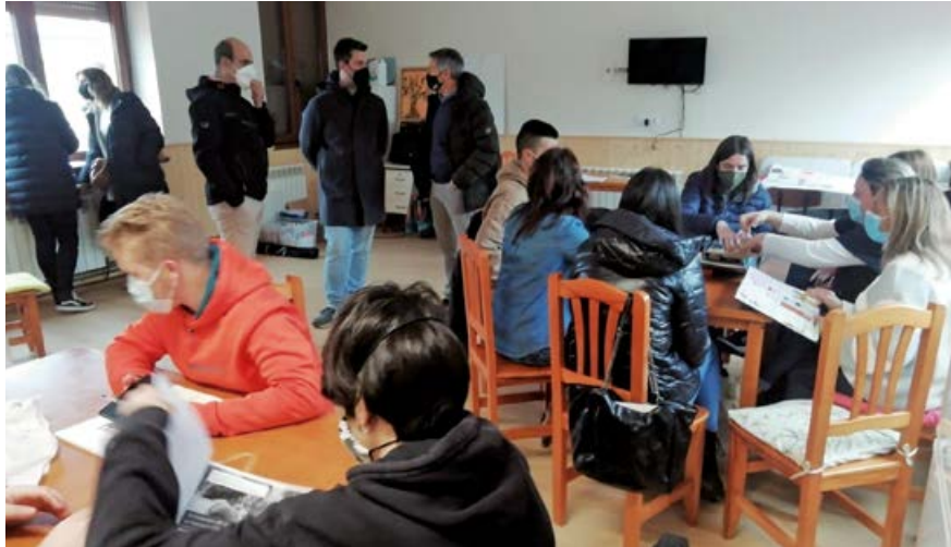
Momento de la clausura del curso

El primero de ellos, denominado “Monitor de comedor”, ha contado con la inscripción de doce participantes con el objetivo de formarles en el conocimiento del funcionamiento del comedor escolar. Además se impartieron conocimientos destinados a elaborar un proyecto educativo junto con el centro escolar y obtener estrategias en gestión de equipos. Por otro lado, el curso hizo especial hincapié en el conocimiento del marco legal y laboral relacionado con el comedor escolar. Respecto al curso de “Auxiliar de tiempo libre”, impartido en los locales sociales de Bolmir, tuvo como principales objetivos el aprendizaje de técnicas y recursos de animación en actividades