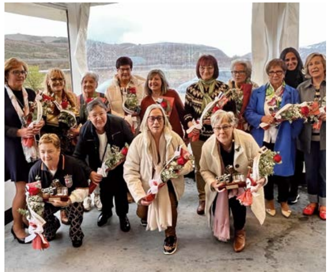
Sin ellas no hubiera sido posible