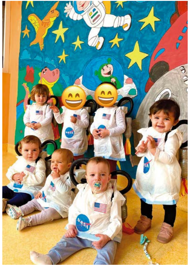
Los más mayores celebrando carnaval

La escuela cumple de esta manera el doble objetivo de fijación de la población al tiempo que ofrece a los padres una oportunidad de conciliación de la vida laboral y familiar. Para alcanzar esos objetivos, sus precios son módicos y asequibles a cualquier familia.