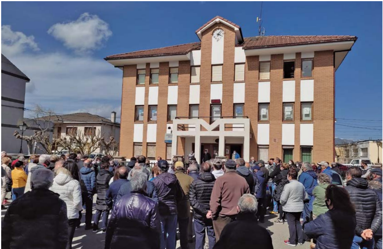
Concentración del 11 de abril