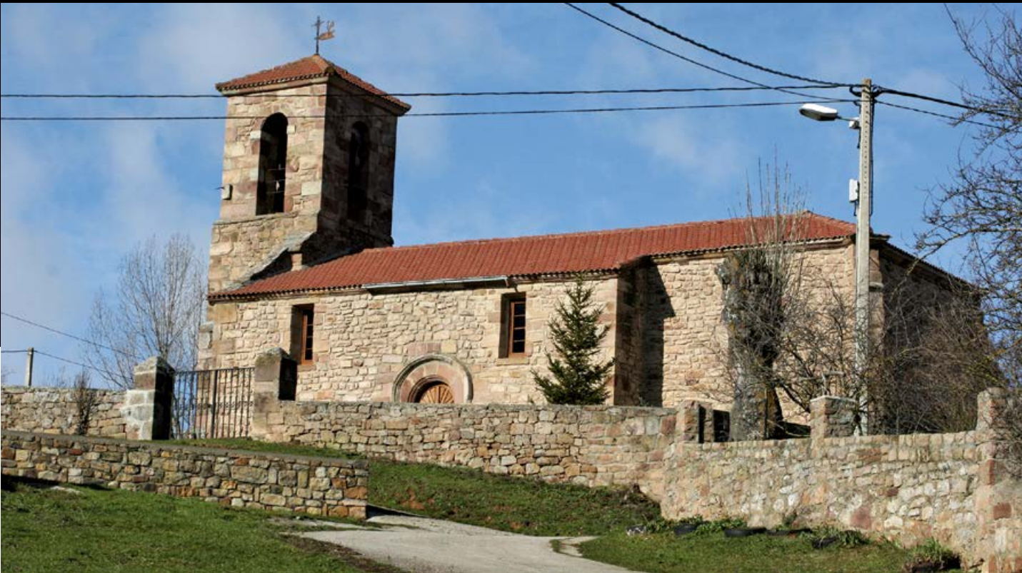
Vista de la iglesia de Villaescusa