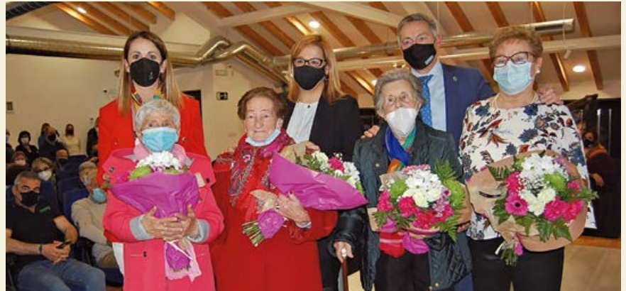
Homenajeadas junto a las autoridades

Al acto acudió la Diputada nacional Elena Castillo, quien hizo especial hincapié en la igualdad de trato,