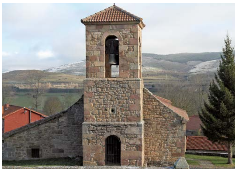
Campanario de Santa Lucía

Localidad que se encuentra al pie del monte Endino, a 3 km de Matamorosa. Destaca su bosque de robles y hayas, así como una importante colonia de cigüeñas blancas.