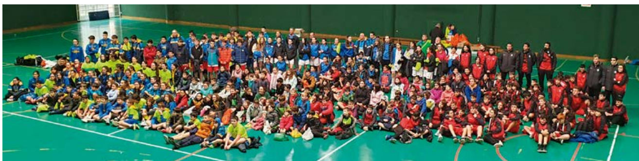
Participantes en la convivencia donde Campoo de Enmedio tuvo papel destacado

El baloncesto volvió a reunir el fin de semana del 17 y 18 de diciembre a más de 300 jóvenes en Aguilar de Campoo.