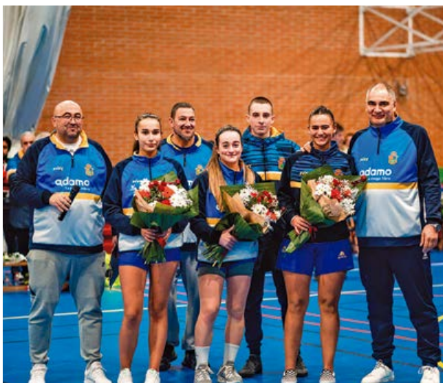
La jornada finalizó con varios homenajes

Los homenajeados, representaron a todos los que en algún momento de la vida, han tenido relación con el Baloncesto Femenino Campurriano.