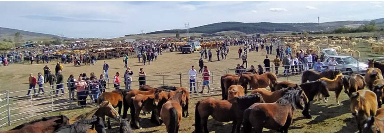
Feria anual del Ayuntamiento