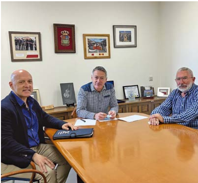
Reunión con la Federación de Bolos de Cantabria