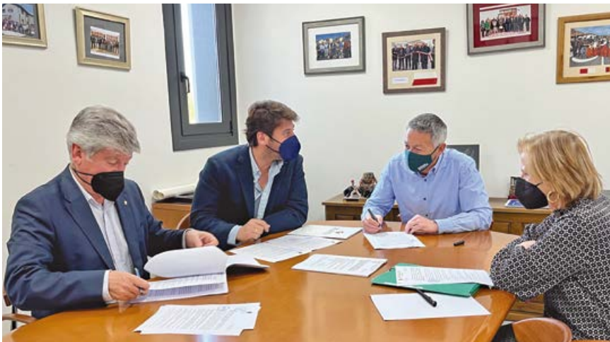
Acto de firma del contrato con la nueva empresa

Los vecinos de Campoo de Enmedio dispondrán a partir del verano de considerables mejoras en el proceso de gestión tributaria y recaudación, sobre todo en lo concerniente a información y facilidades en el pago de los diferentes tributos.