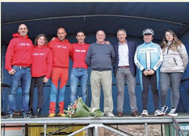
Ayuntamiento, Junta Vecinal y ADC Que Fue a lo largo del homenaje

A lo largo de los meses de enero o febrero de 2023, tendrá lugar el acto oficial para la puesta de largo de la nueva denominación del espacio público.