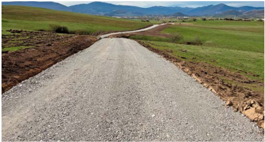
Vista de la nueva pista