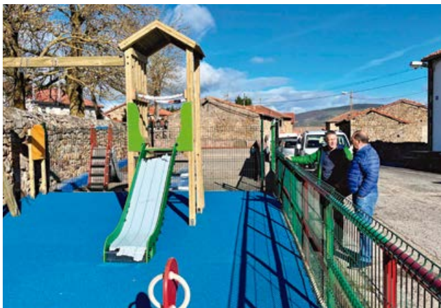
Nuevo espacio infantil junto a la bolera

El Ayuntamiento ha concluido así mismo las obras de mejora llevadas a cabo en el parque infantil existente en el centro del pueblo. Se han regulado las normas mínimas de seguridad y prevención de accidentes que deben reunir los parques infantiles y áreas de juego para la infancia, sus equipamientos y elementos de juego.