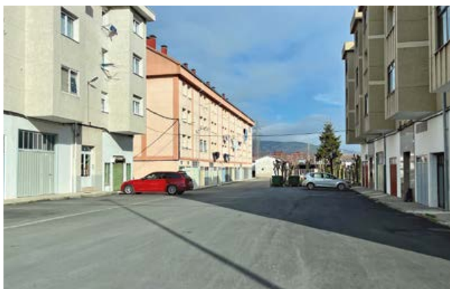
Asfaltado en Matamorosa