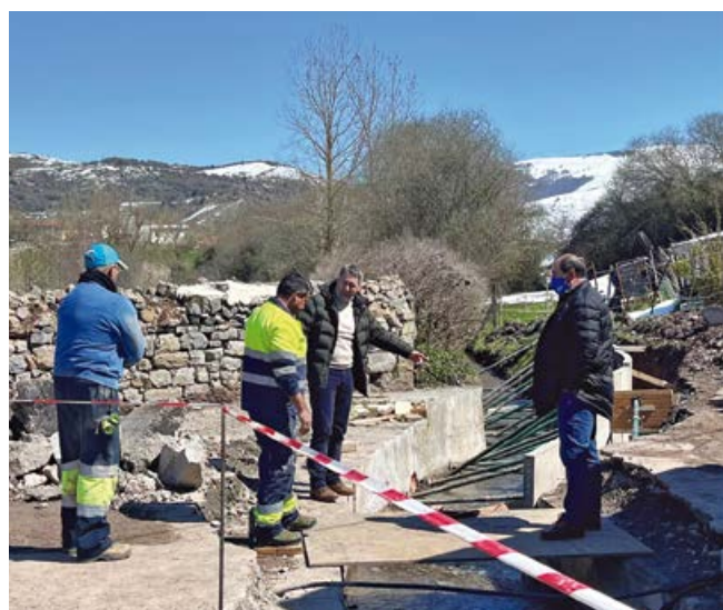
Obras de ampliación del paso del arroyo Sebastián

Este cauce fue el responsable de las gravísimas inundaciones que sufrió la localidad en el invierno de 2019, en el que varias viviendas fueron anegadas completamente en su planta baja por la fuerza de las aguas que desde el río Ebro trasvasaron a través del puente del ferrocarril desde Reinosa. El arroyo Sebastián presentaba una gran estrechez a su llegada al pueblo de Cañeda. Un pequeño paso inferior de unos nueve metros de longitud impedía el normal discurrir de las aguas debido a los continuos rellenos y atascos producidos por los arrastres. Por otro lado, su limpieza y dragado se hacía imposible dada la estrechez y longitud en curva de dicho paso.