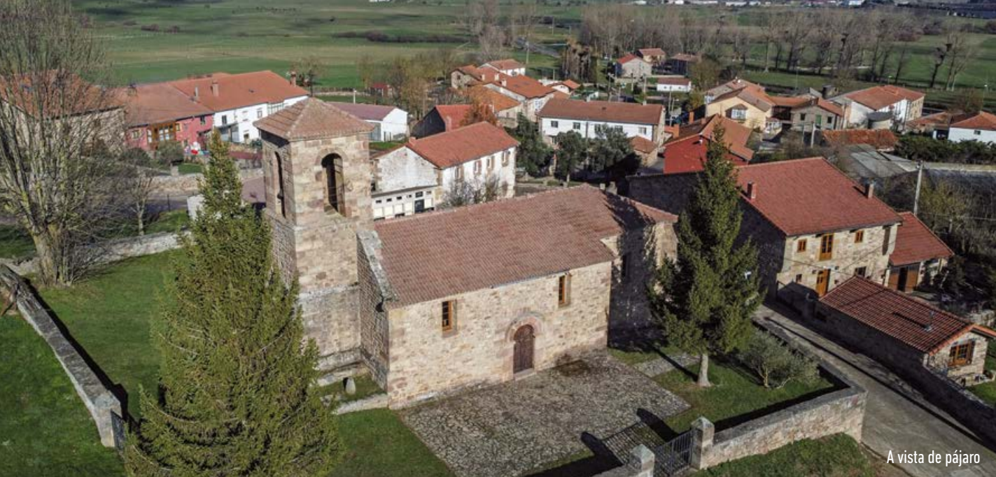
A vista de pájaro

que llevarla a los últimos años del siglo XVII, destacando el retablo mayor, de 1622, obra de Pedro Gutiérrez de La Llanosa con esculturas de Antonio Flor.