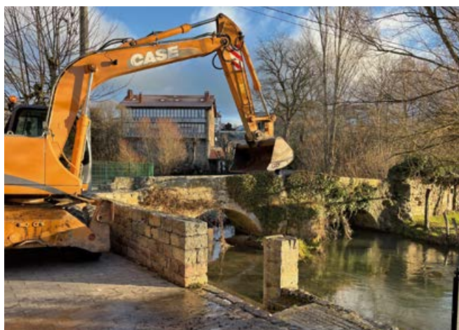
Obras de limpieza en el entorno urbano del cauce