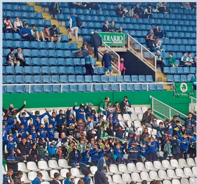
Acompañando al Racing