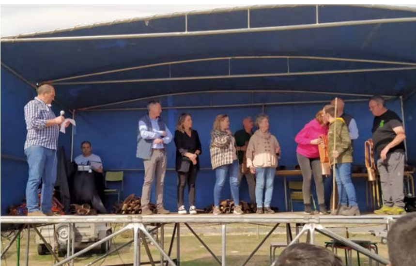
Entrega de campanos

Mención aparte merece, concluye Martínez, el trabajo de los muchos ganaderos que desplazaron su ganado al recinto ferial, y sin cuya participación no hubiera sido posible el éxito de la feria.