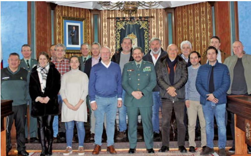
Alcaldes y representantes municipales en la reunión

El alcalde del municipio agradeció a la dirección de la empresa la gran oferta laboral que supone Gullón para nuestra comarca, así como los convenios de colaboración con el Ayuntamiento que se encuentran ya muy avanzados.