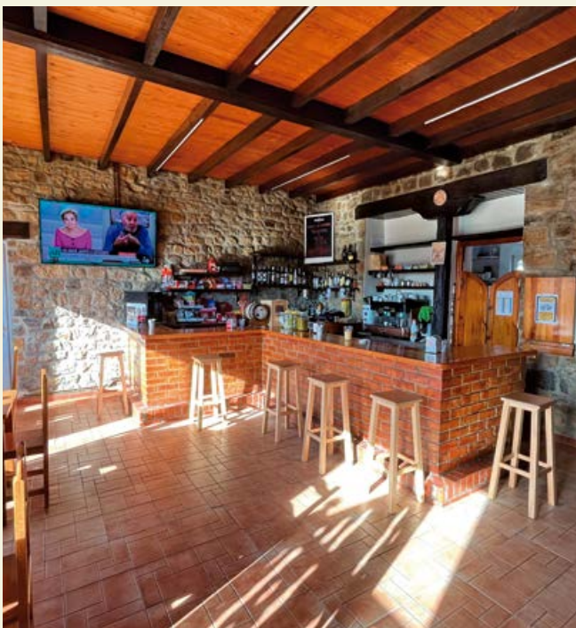
Interior del teleclub de Requejo tras las obras de rehabilitación

Por todo ello, quiero terminar como empecé LOS TELECLUBS Y CENTROS SOCIALES DAN VIDA A LOS PUEBLOS.