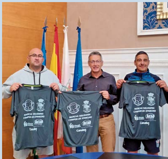
Presentación marcha solidaria

En cuanto al programa Aula Deportiva, a lo largo del 2022 se celebraron las III JORNADAS DE BALONCESTO DE CAMPOO DE ENMEDIO , en el salón de actos de la Casa de los Camineros.