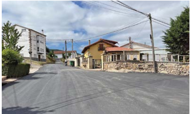
Asfaltados en Bolmir

Dentro de la complejidad económica que supone la administración de dieciséis núcleos de población, el Ayuntamiento ha equilibrado las actuaciones dando prioridad a los viales en estado más crítico en cuanto a su deterioro, blandones, envejecimiento, descarnaduras, seguridad, soporte de tráfico, etc.