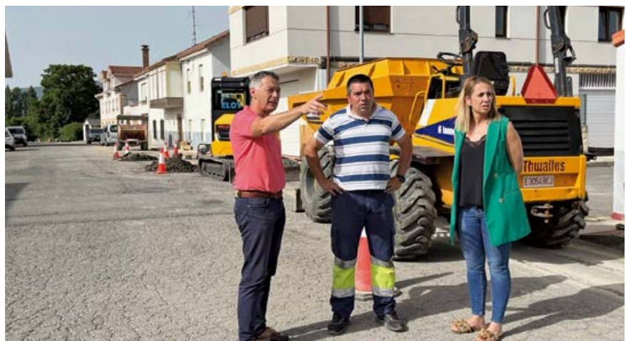
Visita del alcalde a las obras de entronque con la presidenta de la Junta Vecinal de Nestares

A tenor de la buena organización de las obras y consecuencia de las previsiones municipales de asfaltado para el verano, el