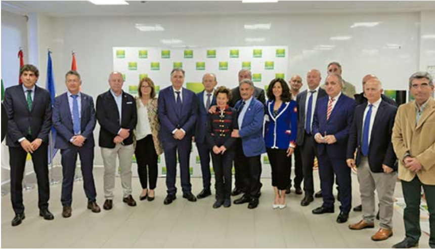
Participantes en la visita a la fábrica

El 25 de mayo, invitado por la dirección, el alcalde del municipio participó en una visita institucional a la fábrica de Gullón en Aguilar de Campoo.