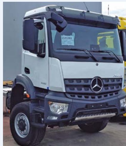
Nuevo camión listo para acarrear

El vehículo será una realidad a lo largo de los meses de enero y febrero de 2023.