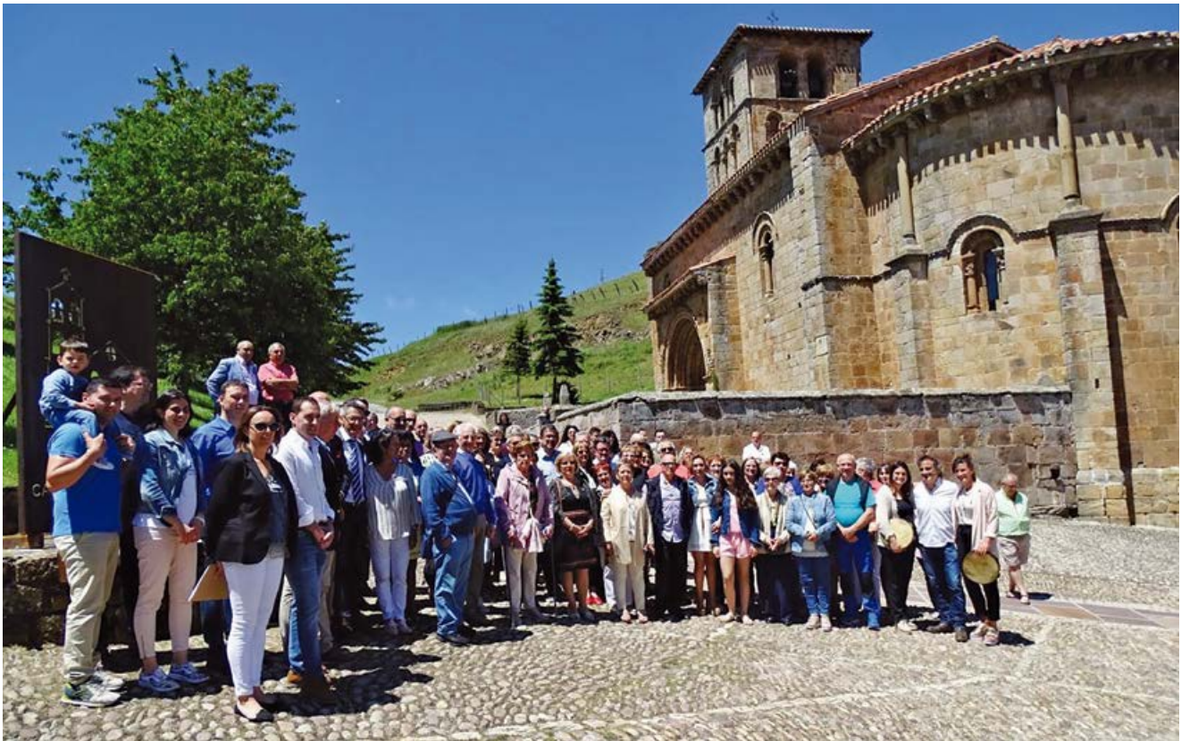
Vecinos de Cervatos