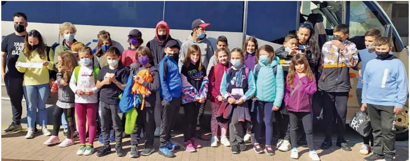
Nuevo campamento a Santoña

El Ayuntamiento organizó un nuevo campamento urbano del 6 al 8 de mayo en la localidad de Santoña, dando así continuidad a la serie de salidas organizadas en la primavera para los jóvenes empadronados en el municipio.