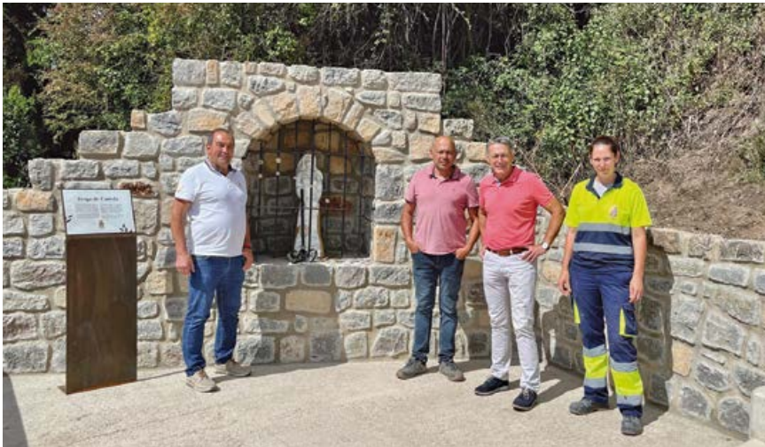
Puesta en servicio del nuevo espacio público