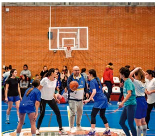
Las jugadoras recordaron viejos tiempos

“Lo que una cancha de baloncesto y un balón unió, nunca se olvidará. Eso queda para siempre”.