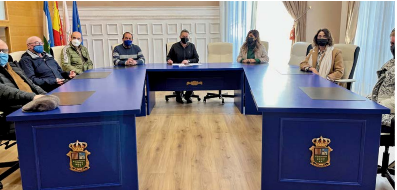
Momento de la entrega de premios