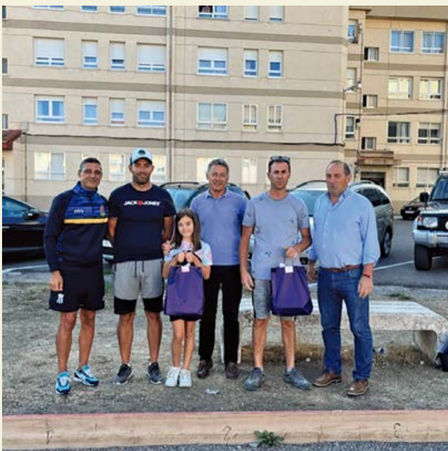
Ganadores del concurso de petanca