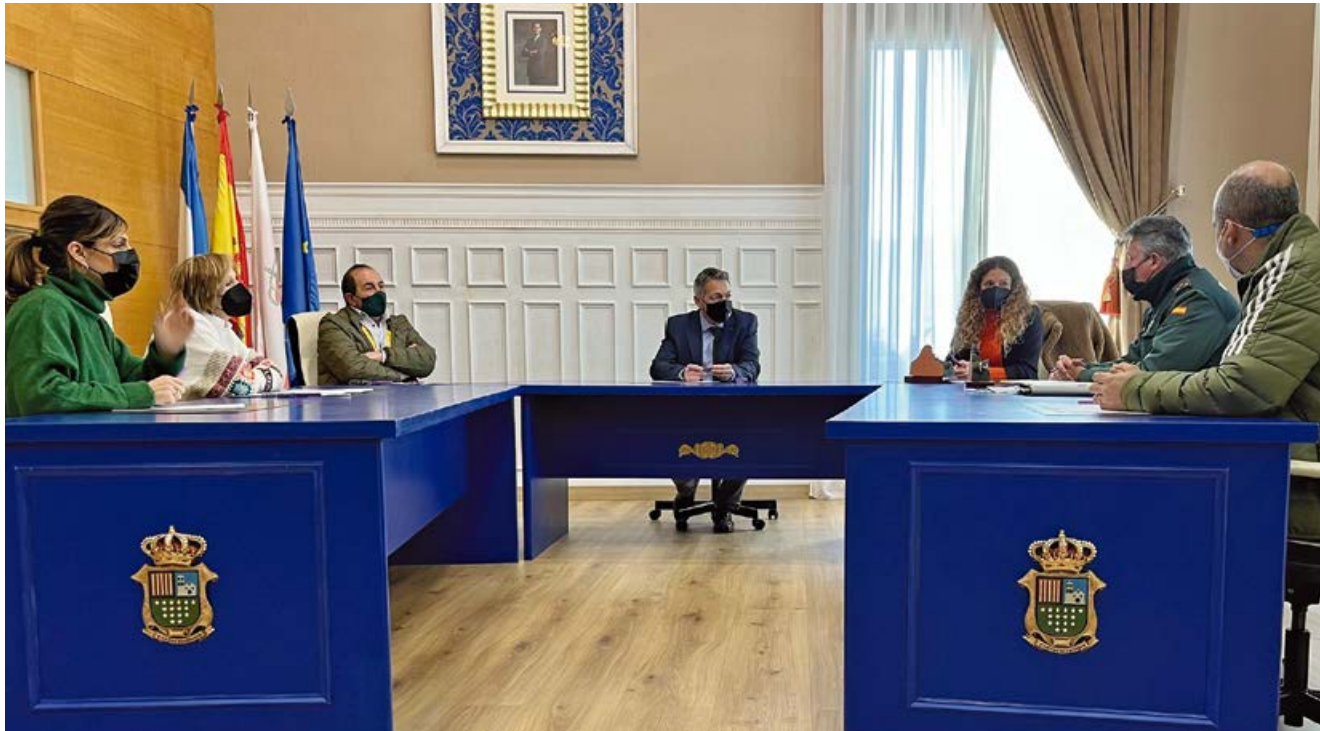
Reunión con la Delegada del Gobierno y Guardia Civil

A petición del alcalde de Campoo de Enmedio tuvo lugar una reunión en el Consistorio campurriano con la Delegada del Gobierno en Cantabria, Ainoa Quiñones, para tratar en tema de gran relevancia como son los continuos robos que se viene produciendo en viviendas del municipio.