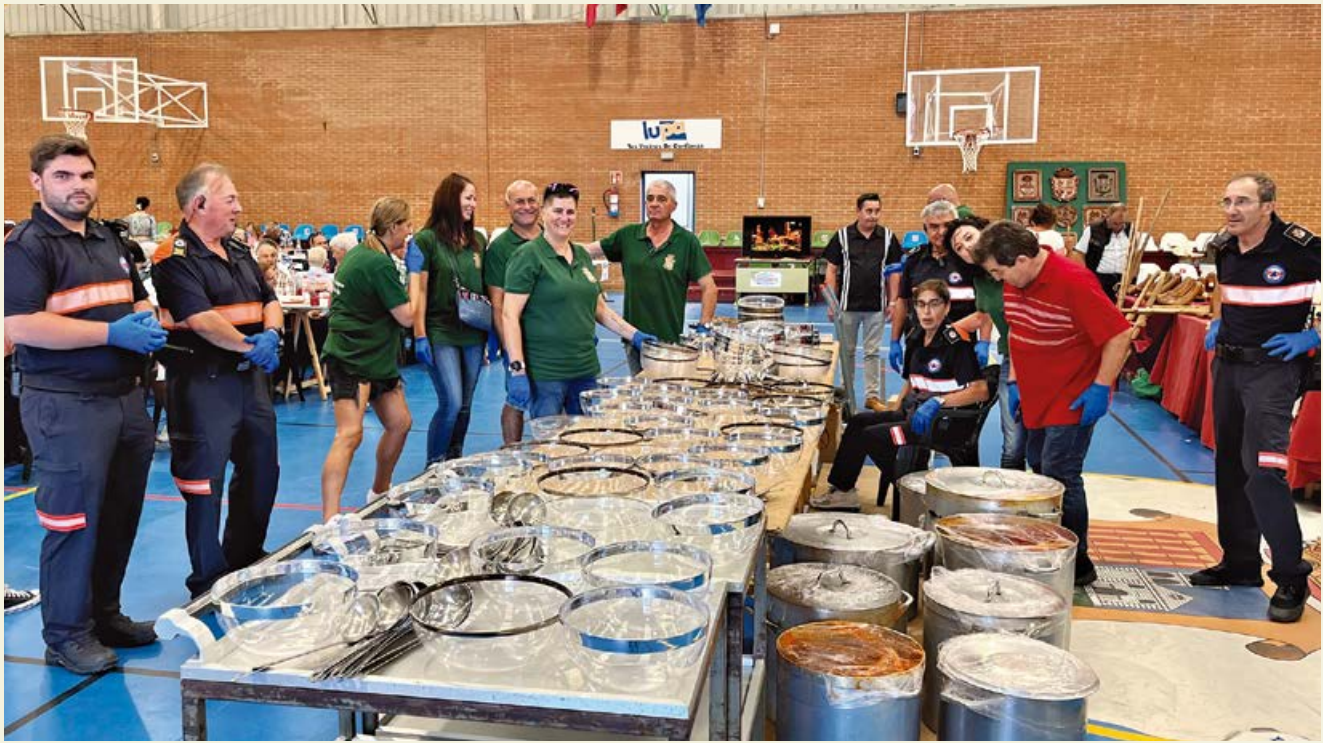
Empleados municipales en el reparto de comida por gentileza del Restaurante Pico Casares