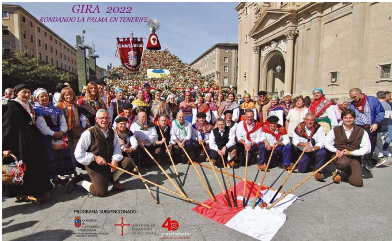
La Asociación en su XXII participación en la Ofrenda de Frutos

Recién finalizada la pandemia y después de año y medio en el que las actividades culturales y sociales estuvieron frenadas por los efectos del Covid, la Asociación Cultural de Fresno celebró sus bodas de plata volviendo al trabajo habitual y a la programación normalizada de las muchas actividades que desarrolla anualmente.