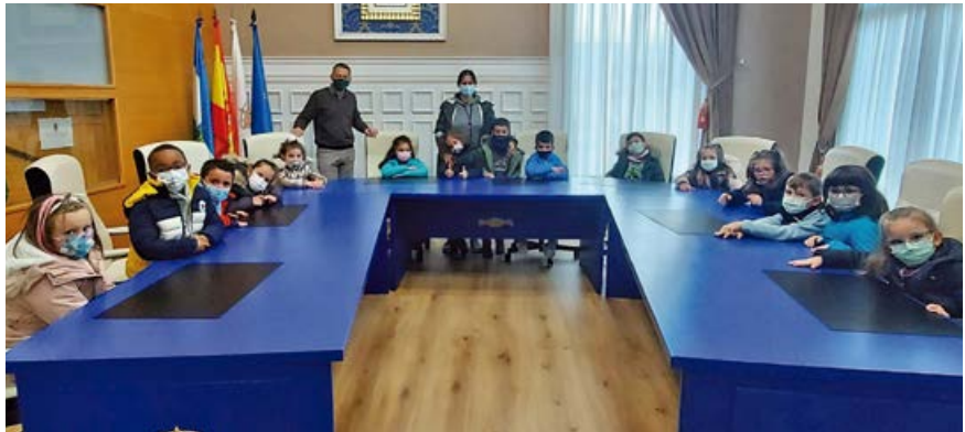
Alumnos en plena participación

Tanto el Colegio como el Ayuntamiento consideran necesarias y muy provechosas este tipo de visitas.