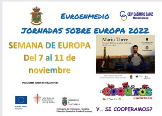
Invitación a las jornadas

El jueves, 10 de noviembre, contamos con el “Concierto Didáctico de música tradicional cántabra y europea” a cargo de Mariu Torre. “Un viaje por la música tradicional de Cantabria a través de algunos de sus instrumentos musicales más característicos, estableciendo puentes de conexión entre las diferentes músicas populares de los pueblos de Europa”.