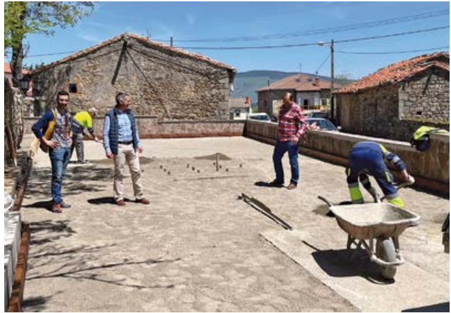
Rehabilitación de la bolera

El Consistorio ha sustituido así mismo la caja de la bolera y colocado nuevos tabloneros perimetrales de protección para finalmente renovar el pavimento y restaurar el remate perimetral del muro. El espacio se complementa con mini parque infantil, al cual el Ayuntamiento ha dado la