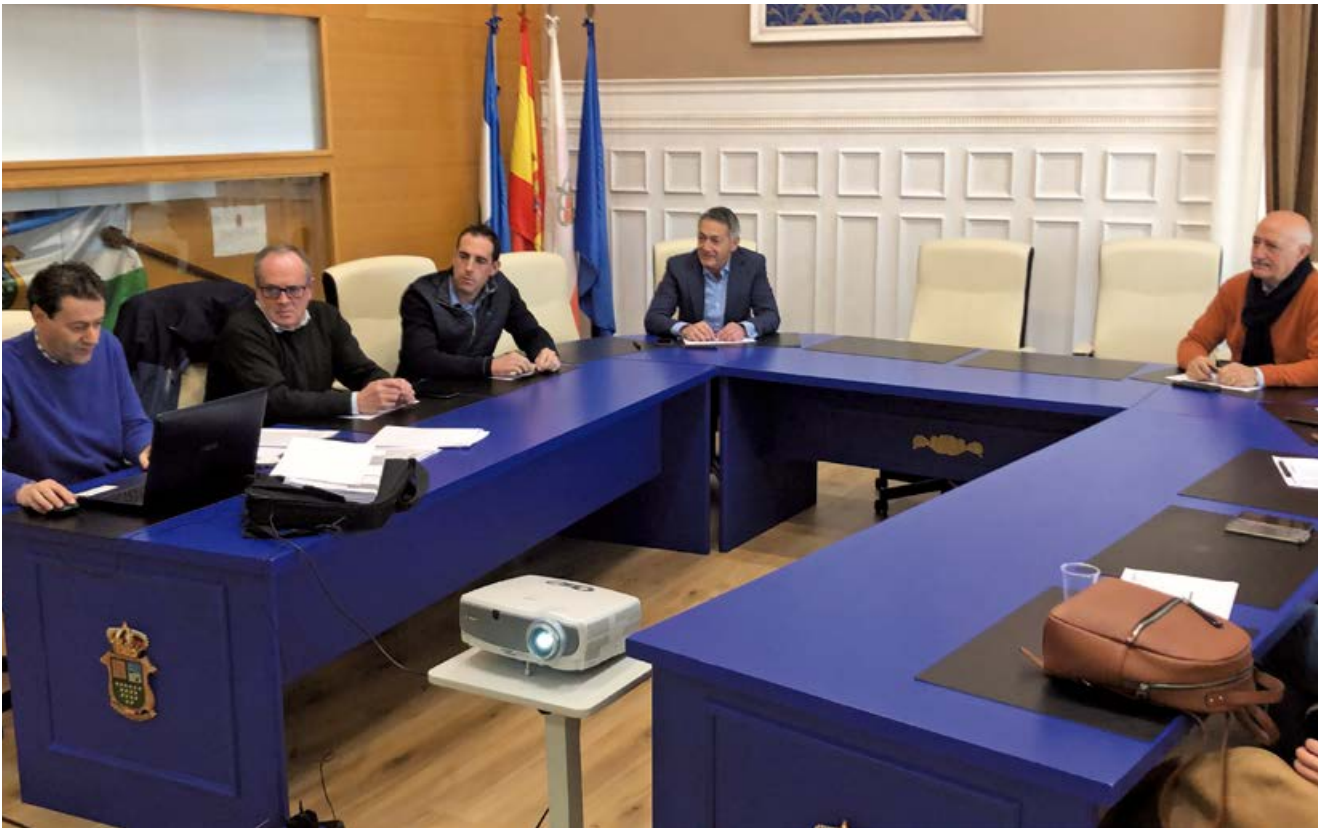
Momento de la constitución

o hayan de ejercer en virtud de las previsiones contenidas en la legislación sobre Administración Local de la Comunidad Autónoma de Cantabria.