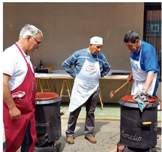
Los vecinos de Nestares oficiaron de cocineros