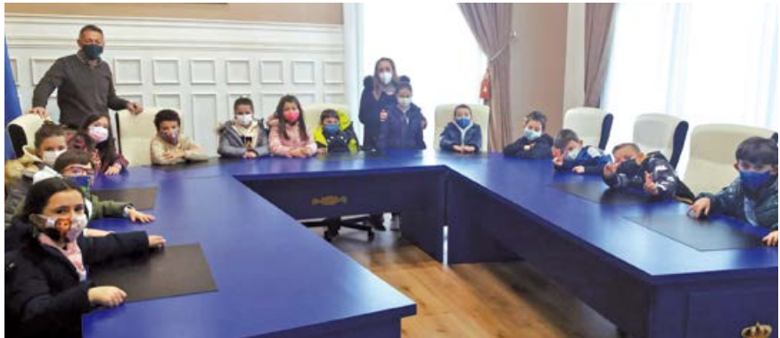
Estas visitas son siempre bienvenidas