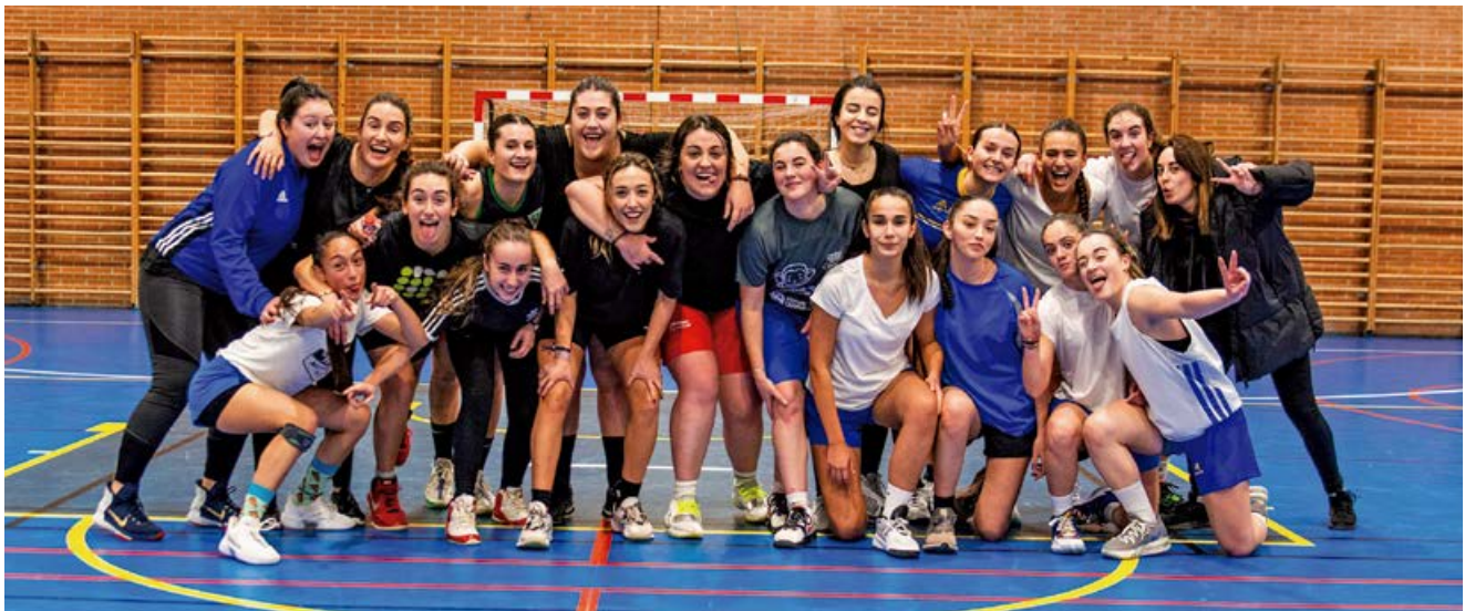
El buen ambiente dominó toda la jornada

Han pasado ya unos días de lo vivido el viernes 23 de diciembre en el II Reencuentro de Baloncesto Femenino Campurriano.