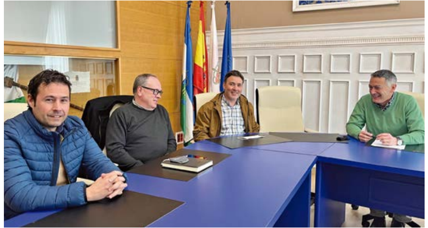
Reunión de alcaldes para reclamar mejores servicios

3. Que por parte de la Consejería de Sanidad se retome el proyecto de rehabilitación del consultorio médico de Matamorosa, ya que en la actualidad no ofrece las condiciones necesarias para una debida atención médica.