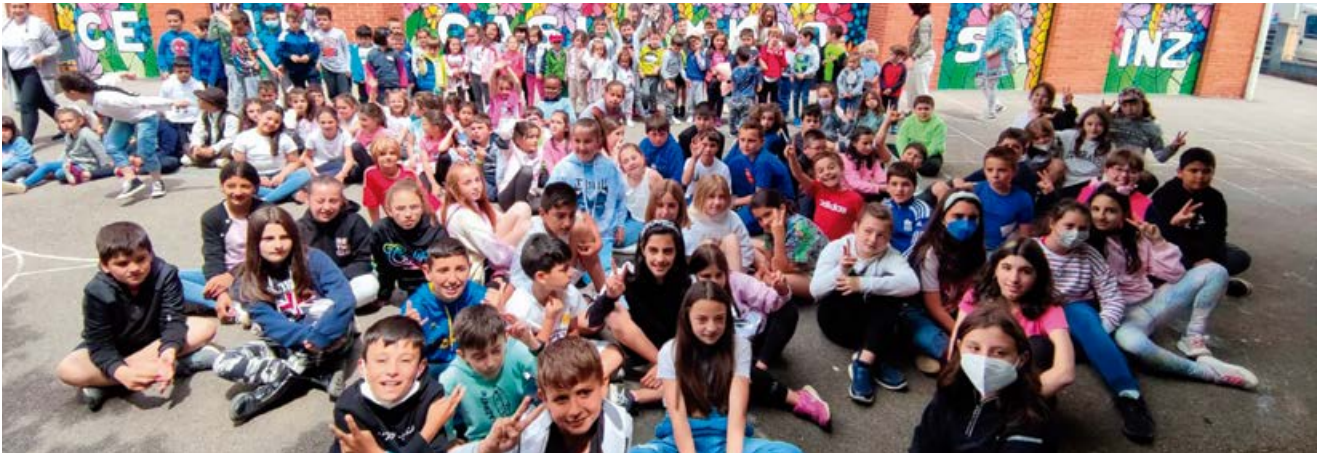
Se organizaron multitud de actividades para una fecha tan señalada

El CEIP CASIMIRO SAINZ de Matamorosa cumplió 50 años, y toda la comunidad educativa que ha formado parte del mismo, desde que inició su andadura en 1972 hasta este 2022, hemos celebrado por todo lo alto su aniversario.