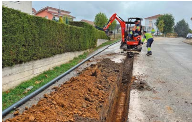
Los trabajos se realizan con las menores molestias posibles para los vecinos

En agosto de 2021 se redactó el proyecto de renovación de la II Fase en la zona norte, debido a la antigüedad de las tuberías, pérdidas y fugas, carencia de válvulas de corte y expansión del casco urbano. Previamente al inicio de esta segunda fase, el Consistorio realizó la renovación de la vía principal que discurre por la calle Los Hornos y da servicio a toda la zona norte de la localidad, por un importe de 27.290 €.