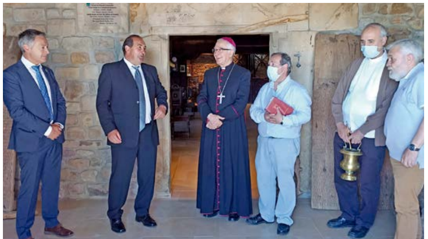
El Sr. Obispo inauguró el museo