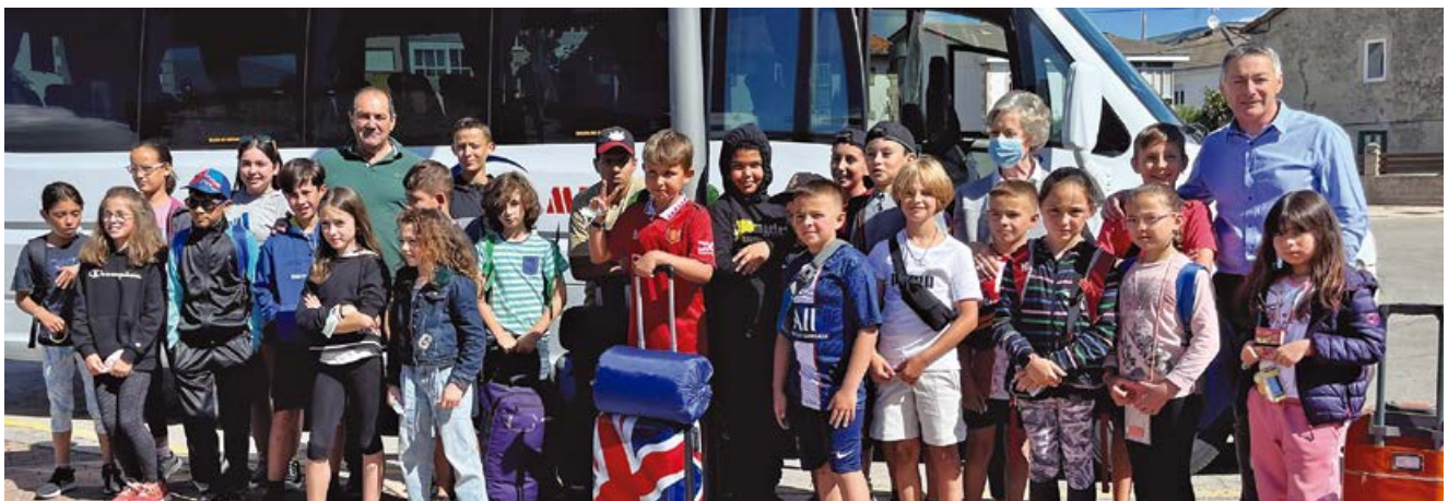
Salida campamento de Noja

La salida, como las anteriores, fue organizada por la concejalía de Servicios Sociales del Ayuntamiento de Campoo de Enmedio y subvencionada por la Consejería de Cultura a través del Plan Corresponsales.