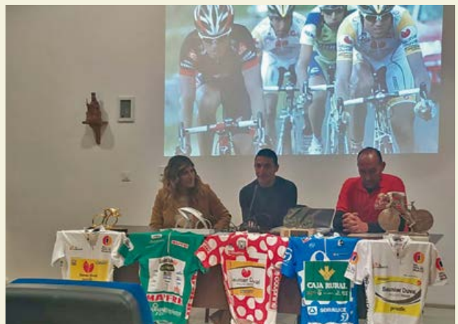
Inauguración de la exposición en Los Camineros