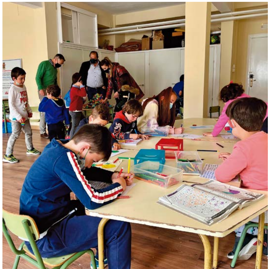
Visita a la ludoteca de Semana Santa