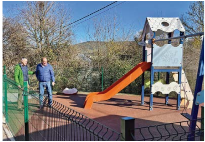
Visita a las obras finalizadas

La ejecución de las obras ha consistido en la retirada de los aparatos actuales, retirada de la capa vegetal, para la ejecución de solera de hormigón armado de unos 15 centímetros de espesor.