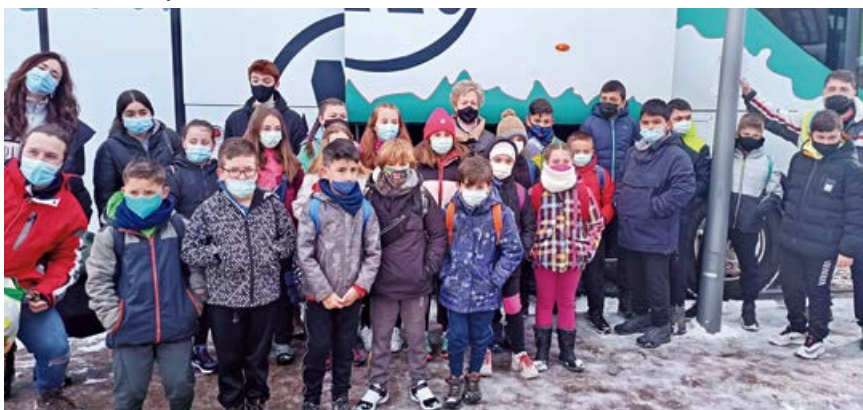
Participantes en el campamento de Gijón

Veinticinco jóvenes pertenecientes al municipio de Campoo de Enmedio disfrutaron el primer fin de semana de abril en Gijón del campamento urbano organizado por el Consistorio campurriano.