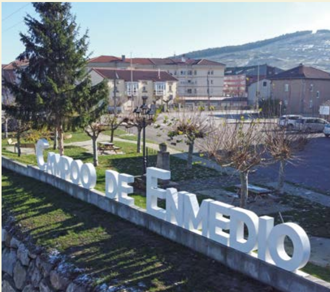
Nuevo parque David de la Fuente