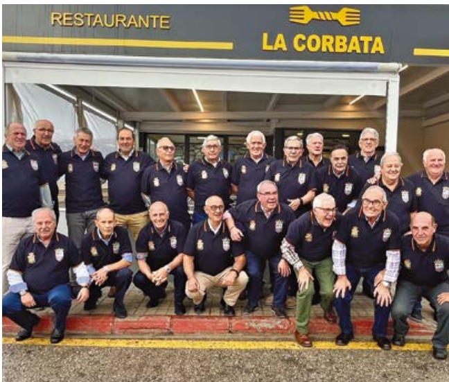
El equipo al completo