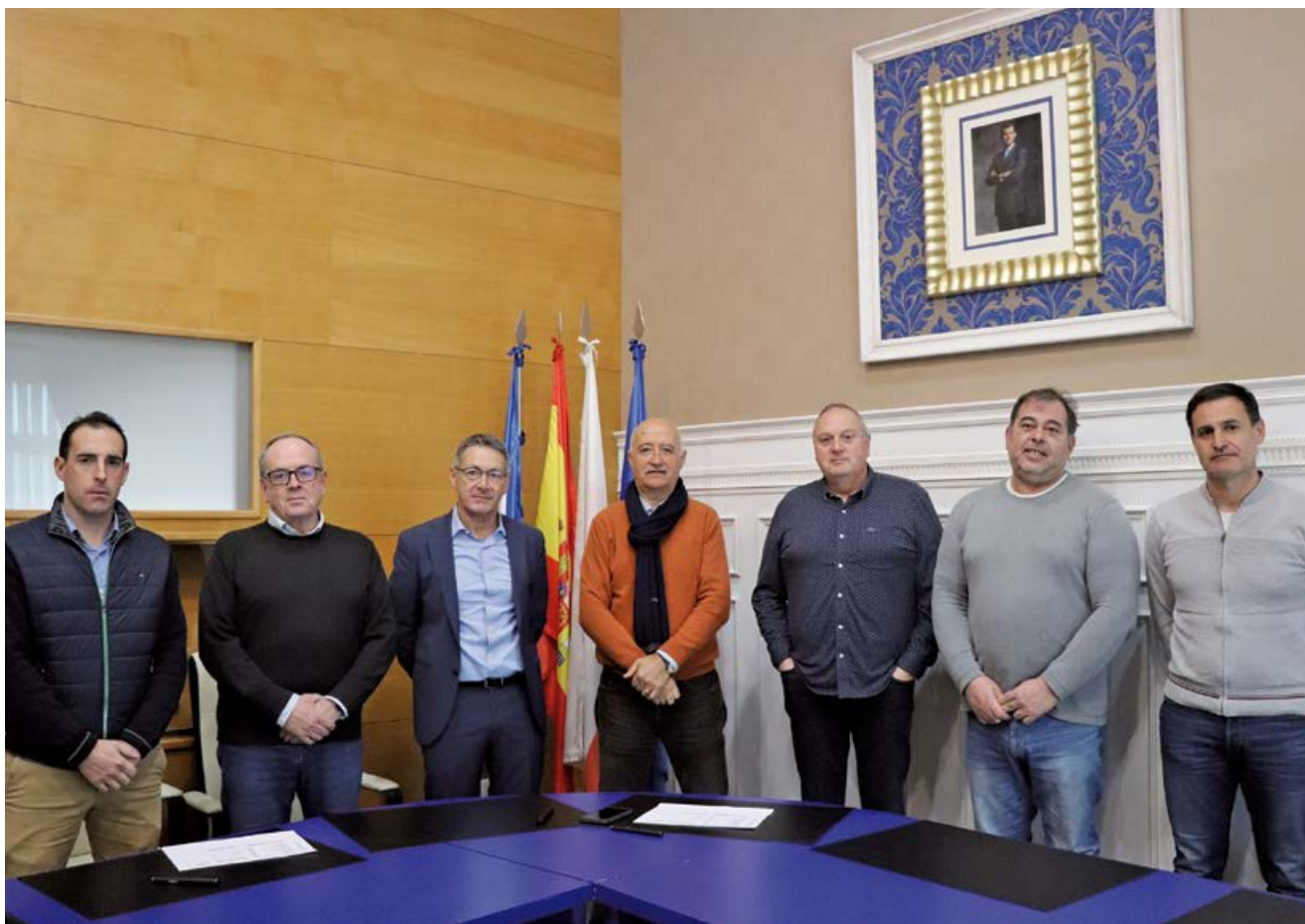
Alcaldes de los siete municipios mancomunados