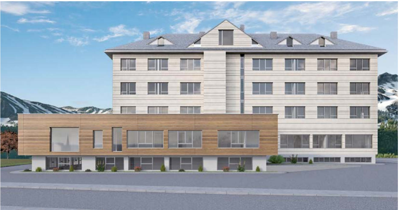
Infografía de la fachada trasera

con un acabado termopiedra, sujeta mediante perfilera auxiliar con cámara de aire rellena de aislamiento, ejecutándose los alféizares y albardillas con el mismo material