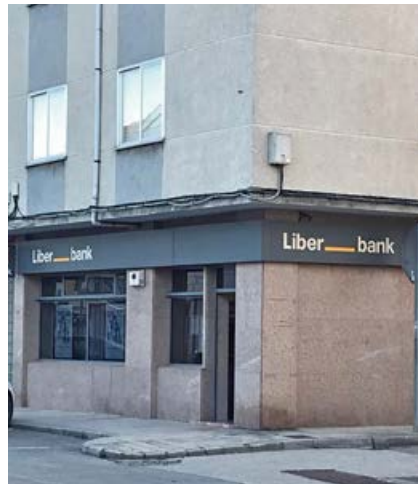
Oficina de Unicaja en Matamorosa

Por otro lado, la sucursal de Matamorosa cuenta como cliente con el Ayuntamiento de Campo de Enmedio y toda su operativa, que es mucha. De cerrar la oficina bancaria sería determinante para dar por concluida esta relación comercial, que ha durado muchos años, al margen de la pérdida de clientes individuales, que sin duda también cambiarían de banco, comunicó el alcalde a responsables de Unicaja.