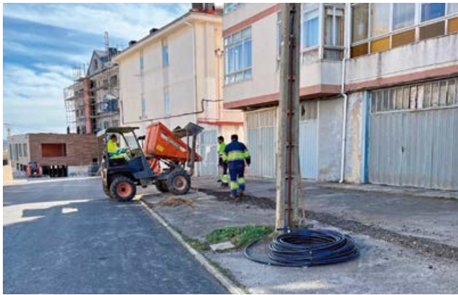
La II Fase afecta a toda la zona derecha de la carretera autonómica a Campoo