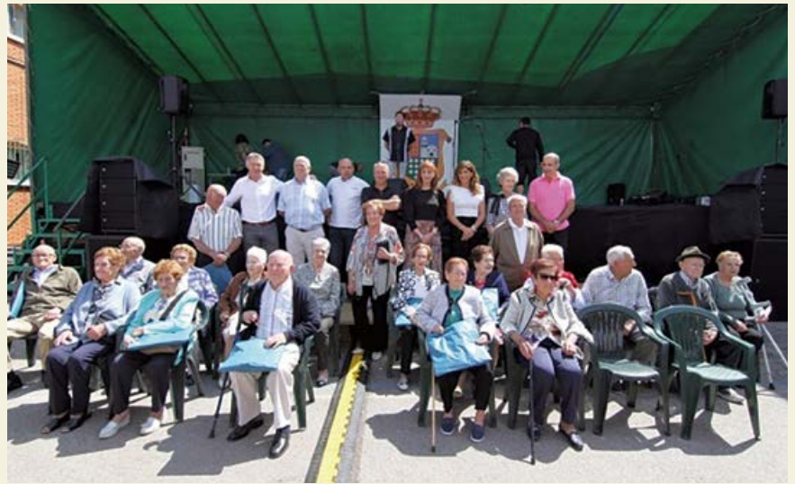
Homenaje a los mayores de 90 años