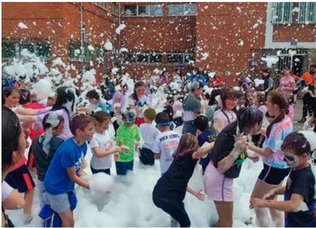
Disfrutando de la fiesta de la espuma