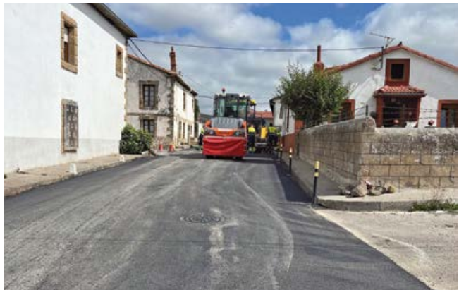
Asfaltados en Requejo

El principal objetivo, por tanto, ha sido la mejora de la seguridad vial de la circulación, tanto de personas como de vehículos, así como evitar los inconvenientes a los vecinos a los que afectan más directamente, dado el estado actual que presentan, con lo que se conseguirá una finalidad pública de interés general.