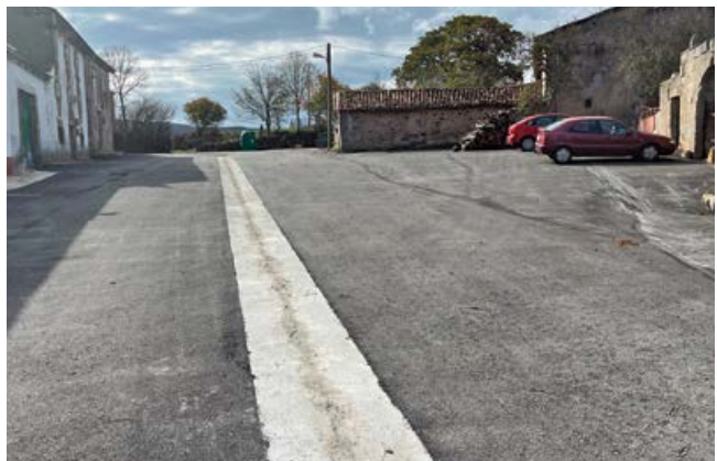
Asfaltado en Villafría