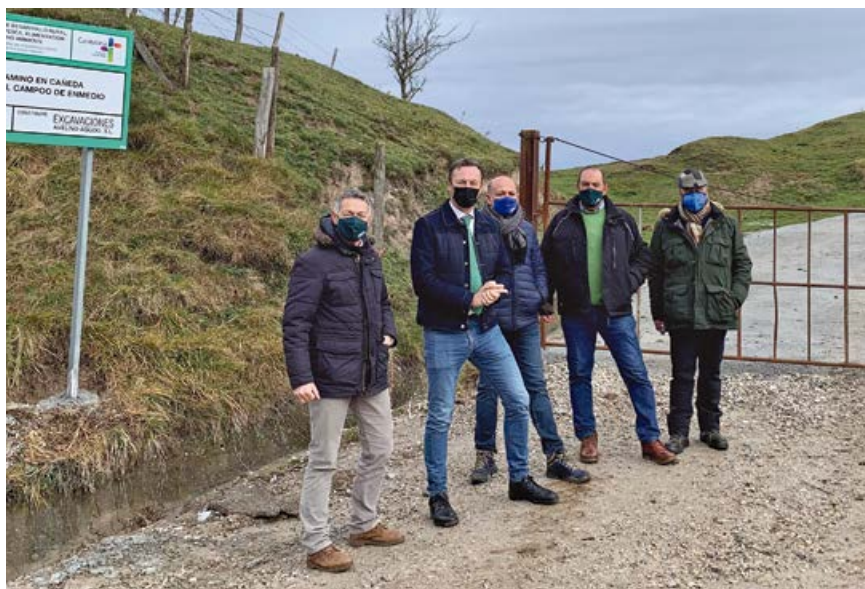
Visita del consejero al nuevo camino

Un vial sobre el que se ha actuado en un tramo de casi medio kilómetro, aplicando una capa de hormigón, el refino y planeo del camino, una capa de zahorra artificial y medidas de seguridad y salud para garantizar unas buenas comunicaciones, tanto a vecinos como a ganaderos. Tras comprobar in situ el resultado de los trabajos realizados,