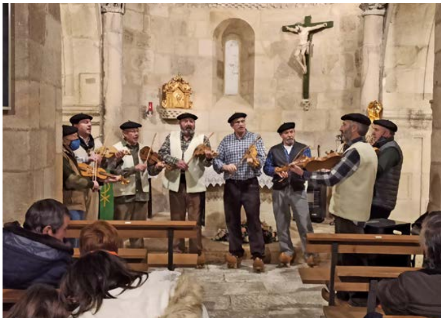
Los rabelistas llevaron las marzas a Bolmir