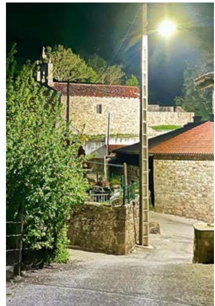
Nueva iluminación LED en Aradillos

El ahorro energético en consumo de estos programas será del 74%, frente al vapor de sodio que existía hasta ahora, mejorando notablemente los criterios de utilidad, seguridad y desarrollo para los vecinos.