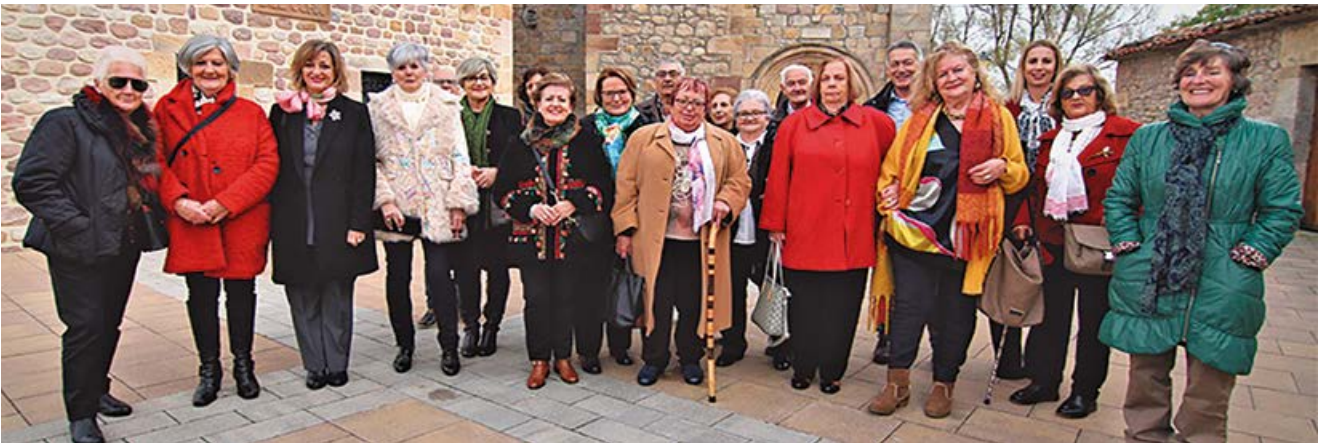
Miembros de la Asociación a la salida de la misa