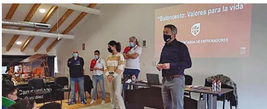
Presentación de la conferencia