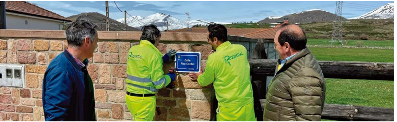
Instaladas nuevas placas en todo el municipio