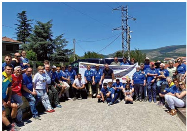
Torneo por la igualdad

Entre otros certámenes, la Asociación organizó el primer encuentro con otros clubs de la región, siendo el Club de Reocín el participante en esta ocasión. Jugadores de Nestares y Reocín jugaron mezclados a lo largo de la mañana par finalizar la jornada con una comida de hermandad en el restaurante del Campo de Golf.