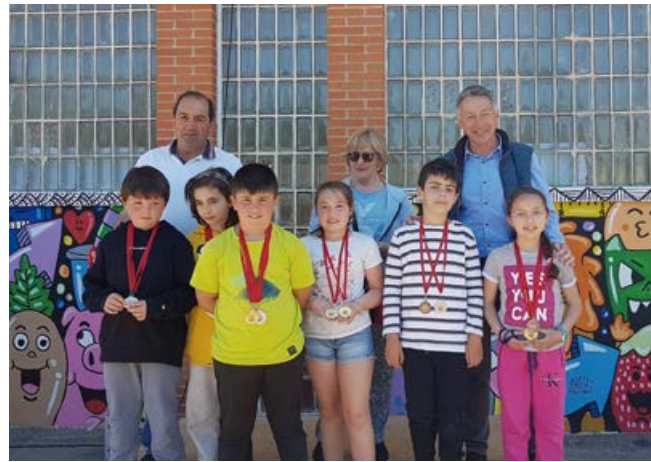
Entrega de medallas a los participantes en los distintos concursos

50 aniversario quiso dar cabida a estos antiguos alumnos y maestros. Fueron ellos a través de la actividad “Lazos que unen” los que contaron al alumnado del centro su experiencia, sus anécdotas y cómo el cole les había ayudado a encontrar su pasión, siendo el Casimiro un punto de referencia que siempre estará abierto para ellos.