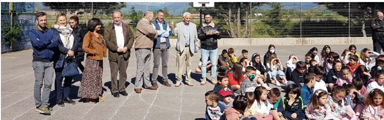
Autoridades asistentes a los actos

Para la actual comunidad educativa es un orgullo seguir educando a hijos y nietos de aquellos que inauguraron el colegio en 1972 y nuestro mayor éxito será recibir los hijos e hijas de los que ahora son nuestro alumnado. Y, aunque ya no nos corresponda a muchos de los que estamos ahora, esperamos que sigáis confiando en nosotros otros 50 años.