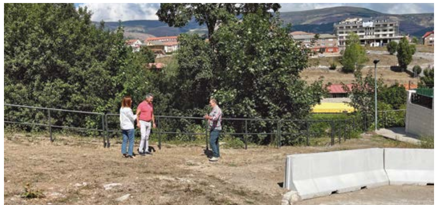
Obras de mejora de la seguridad

El Ayuntamiento ha procedido en primer lugar a colocar una barrera de