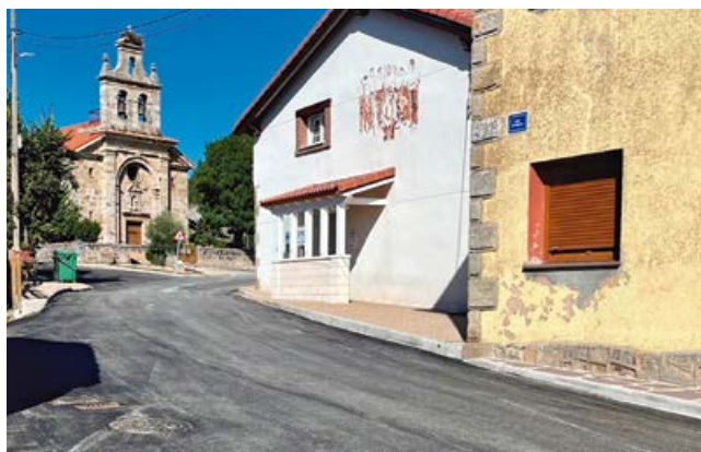
Asfaltado en Fresno del Río

calle Eras en Nestares desde el Barrio San Justo hasta su confluencia con la carretera de Villacantid.