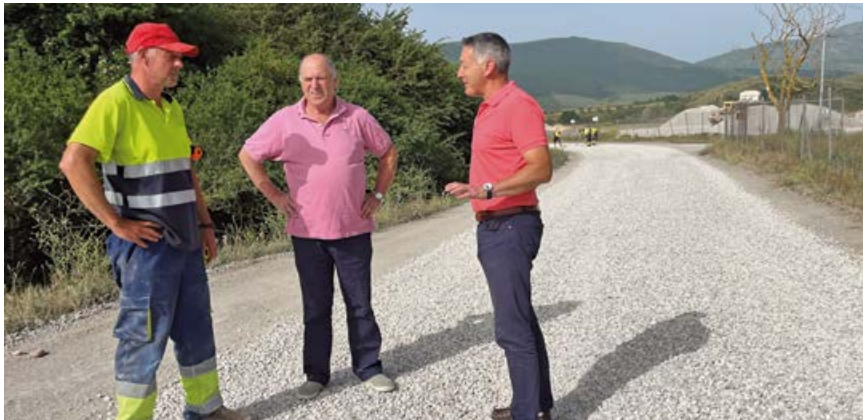
Visita a las obras por parte del alcalde y presidente de la Junta Vecinal de Matamorosa

La bolera recién rehabilitada se sitúa justo enfrente del teleclub del pueblo y centro social, por lo que de esta manera se habilitará un nuevo lugar de reunión de los vecinos, mejorando sensiblemente sus espacios sociales.