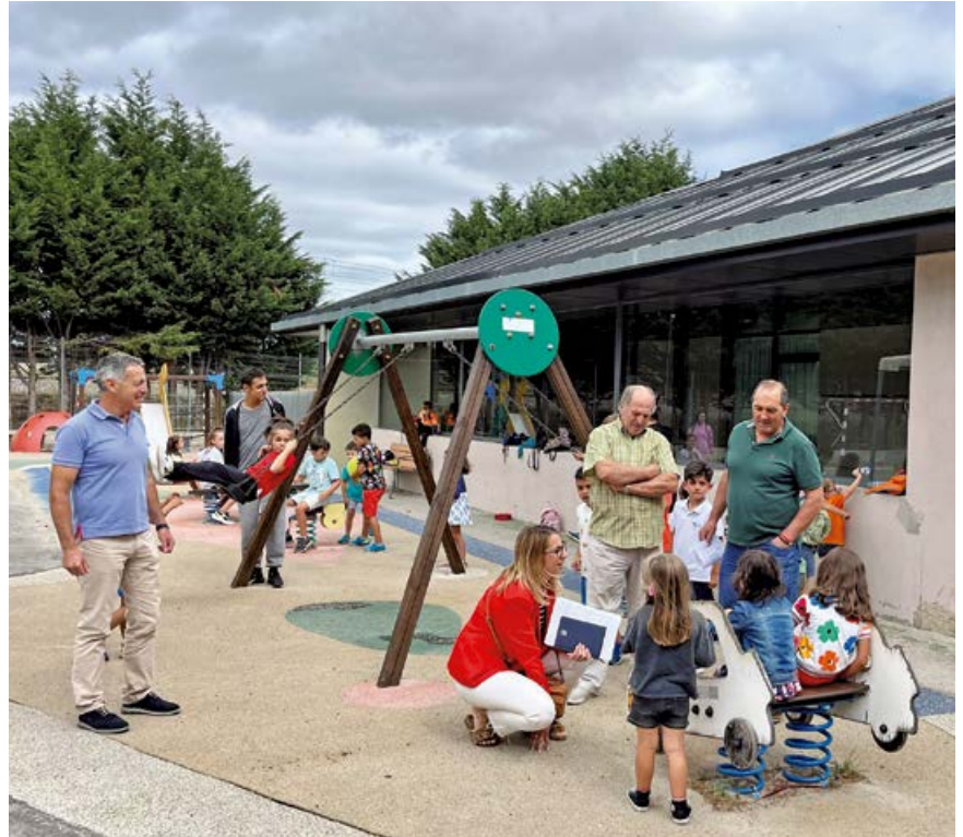
Ludoteca de verano