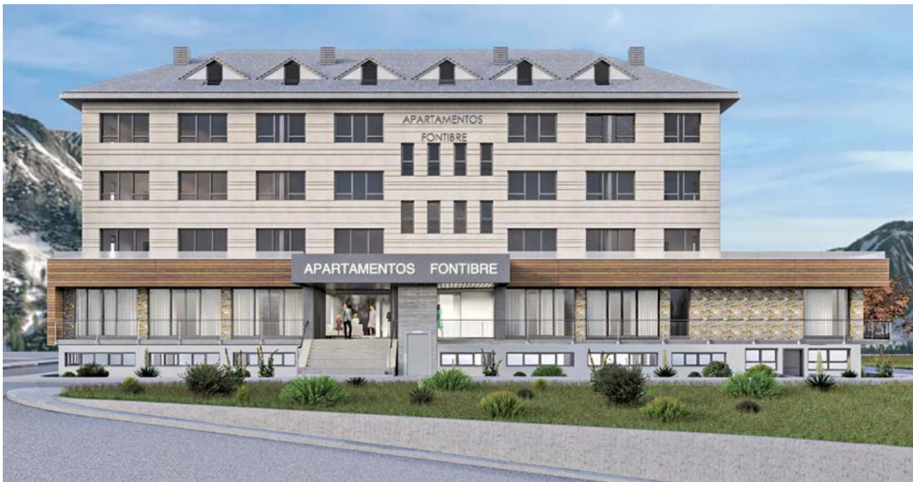
Infografía de la fachada principal

A lo largo de los años, hemos conseguido no sólo atender de la mejor manera posible a nuestros clientes sino consolidar con muchos de ellos una relación personal que sin duda perdurará en el tiempo, matizan desde la empresa.