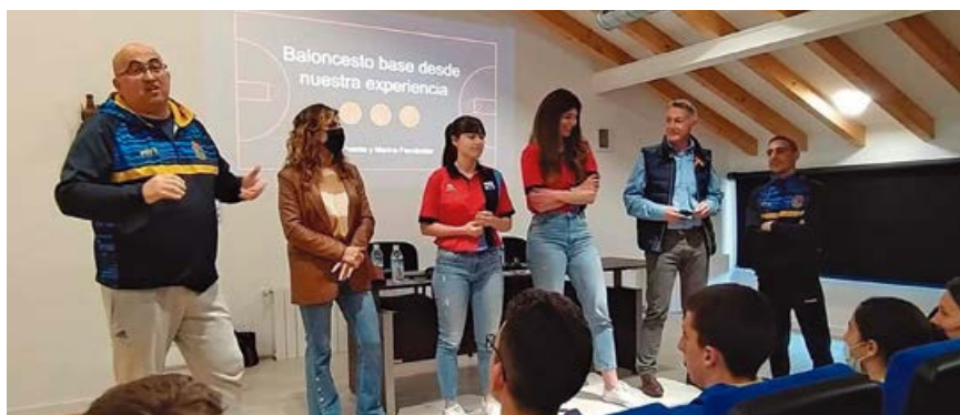
Charlas sobre baloncesto base en La Casa de los Camineros

Este tipo de conferencias va dirigida al público en general, pero con especial hincapié en los componentes de las escuelas deportivas, entrenadores y padres.