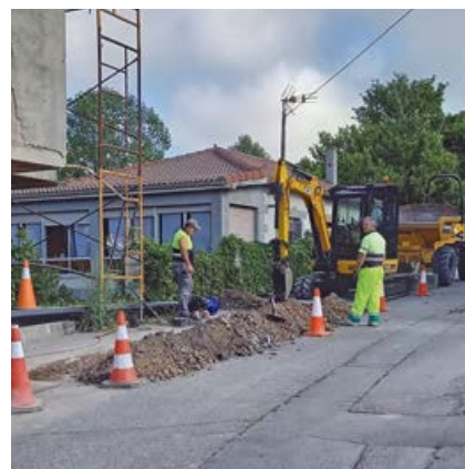
Detalle de las obras

El presupuesto base de licitación de las obras ha sido de 27.290 euros, sufragado con cargo al presupuesto municipal.