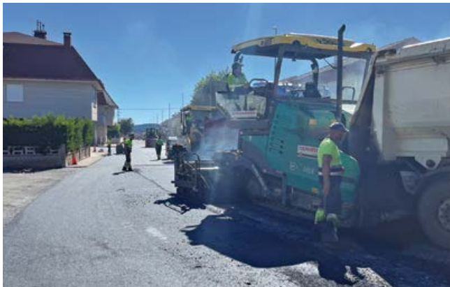
Asfaltado de la calle Eras en Nestares