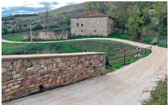
Asfaltado en Villaescusa

El proyecto ha contemplado además tres obras muy demandadas por los vecinos y de un montante económico importante, como son el asfaltado general de la carretera de acceso a Quintanilla, de titularidad municipal, la conexión interior de la zona alta de Villaescusa con el centro del pueblo y el asfaltado de la