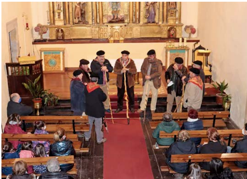
La Esperanza cantó las marzas en Matamorosa

Desde el Ayuntamiento se muestra el agradecimiento a las agrupaciones participantes así como a los Presidentes de Juntas Vecinales y Alcaldes pedáneos que han colaborado activamente en el desarrollo de la actividad. También al cura párroco por poner a disposición las diferentes Iglesias, lugares sin igual para acoger el canto de ronda y rabel.