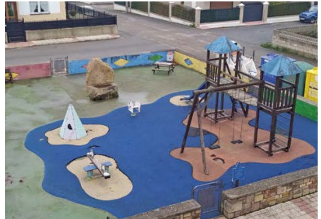
En breve comenzarán los trabajos de rehabilitación del parque Aracillum

La actuación incluye el desmontaje de los elementos actuales así como la instalación de pavimento de caucho continuo en zonas de juego y nuevo mobiliario urbano, combinándose en los bordes del frete y alrededores con áreas de hormigón, creando de este modo un espacio de descanso limpio, con diferentes texturas y experiencias.