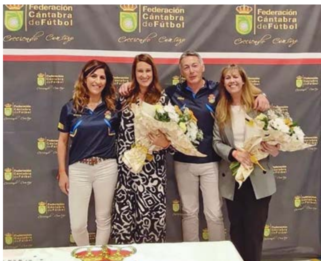
Acto solidario en el polideportivo municipal

Muchas veces, el deporte se une a otros fines con el objetivo de dar visibilidad a ciertos problemas de la sociedad o de alguno de sus colectivos. Somos humanos, y como tales, sujetos a enfermedades. Algunas muy estudiadas y experimentadas y otras con necesidad de recaudar fondos para colaborar en su estudio. Cualquiera podríamos tener la mala fortuna de padecer una de estas enfermedades, y por eso es responsabilidad de todos la colaboración en el estudio de nuevos tratamientos.