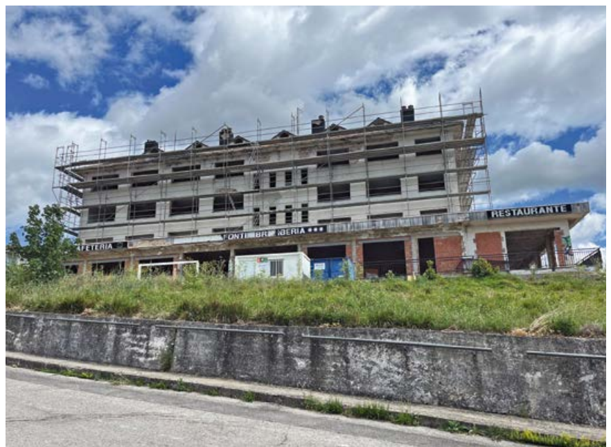
Las obras se ejecutan a buen ritmo