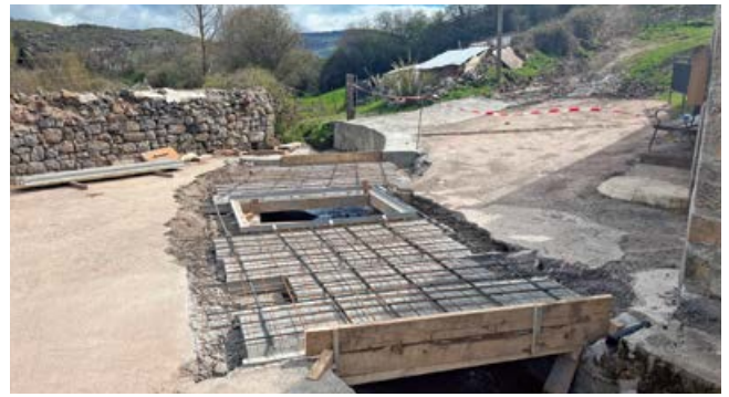
Detalle de las obras

Las obras, realizadas en su integridad por la plantilla municipal, han sido rematadas con una barandilla de hierro similar a las ejecutadas en el resto del casco urbano de Cañeda, quedando con ello integrado todo el entorno.