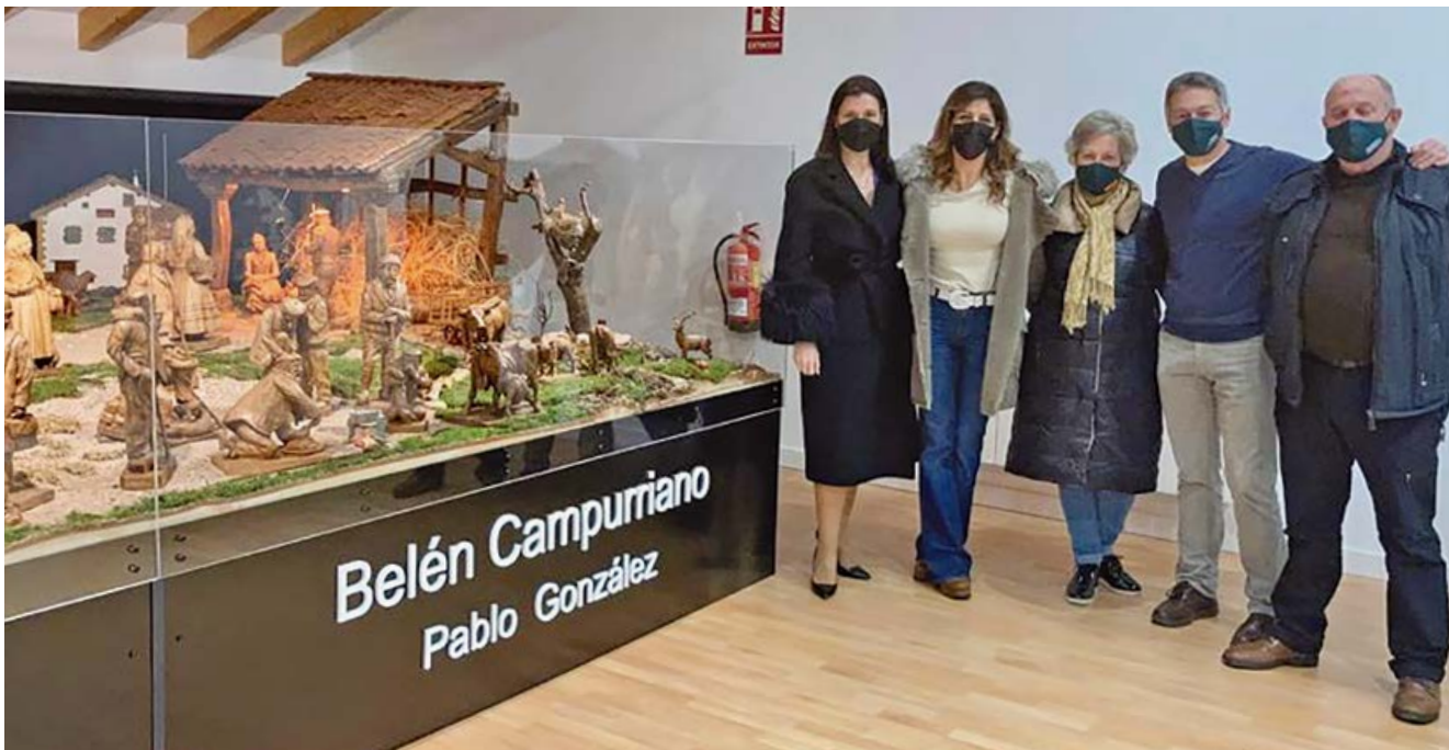
La alcaldesa en la Casa de los Camineros