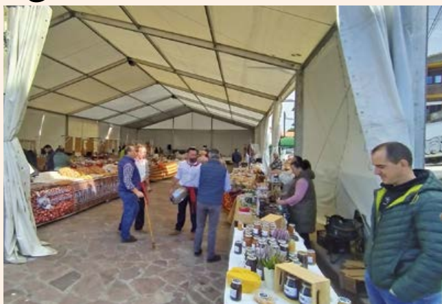
Primer mercado agroalimentario

De forma paralela a la feria, el Ayuntamiento celebró su primer mercado agroalimentario en la plaza Mayor de Requejo, con una participación muy elevada, tanto de puestos como de público.