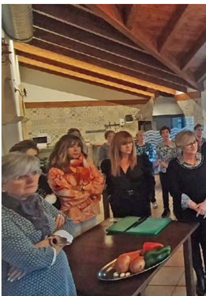
Participantes en el taller