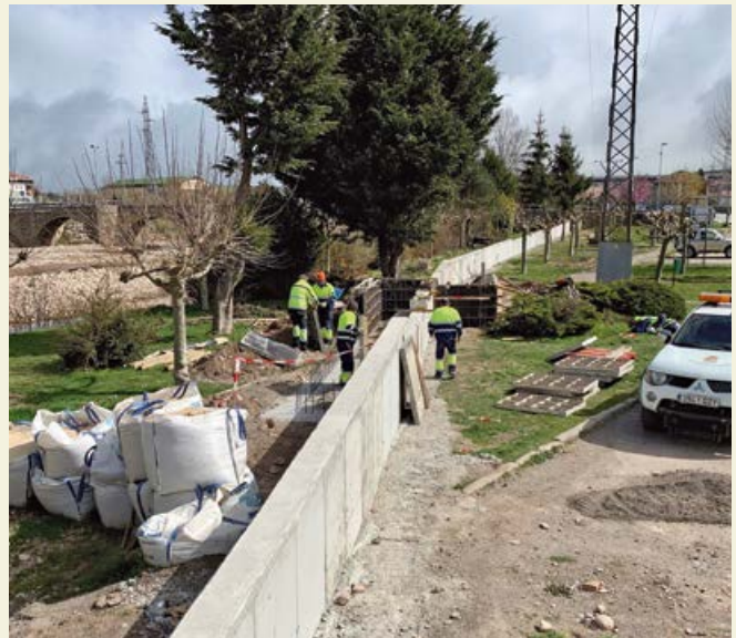
Obras de ejecución del muro de defensa de inundaciones integrado en el parque