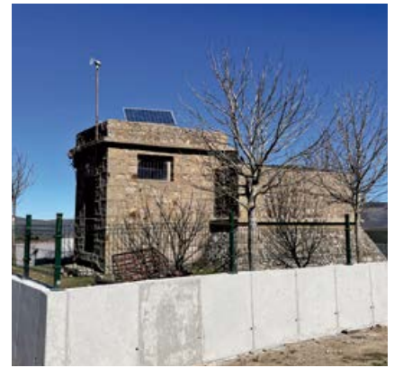
Obras de restauración del entorno del depósito

Esta solicitud fue realizada y seguida, así mismo, por la Federación de Municipios y Gobierno Regional, quienes no consiguieron su propósito. El único logro conseguido fue el mantenimiento del cajero automático, quedando aún sin cerrar las negociaciones.