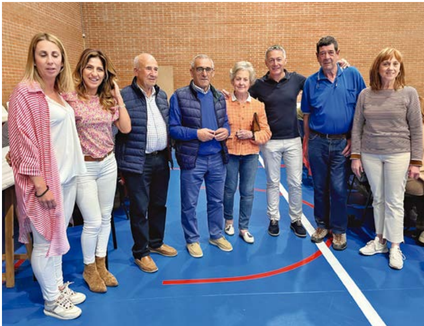
Miembros de la corporación con los cocineros