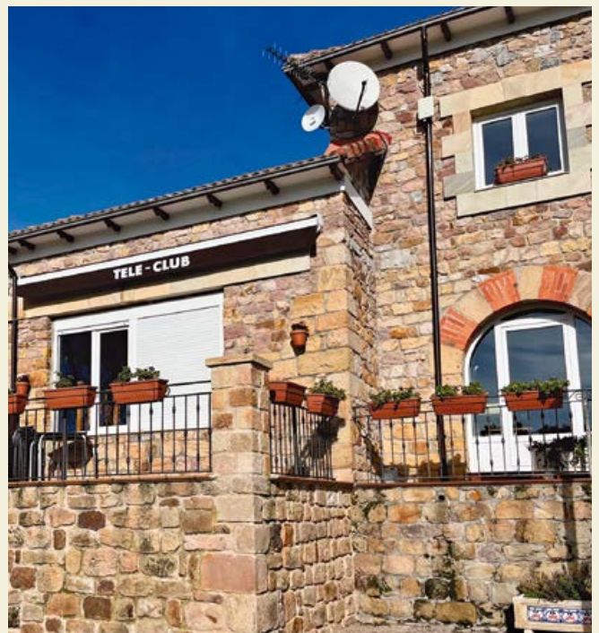
Aspecto de la fachada sur del teleclub de Requejo