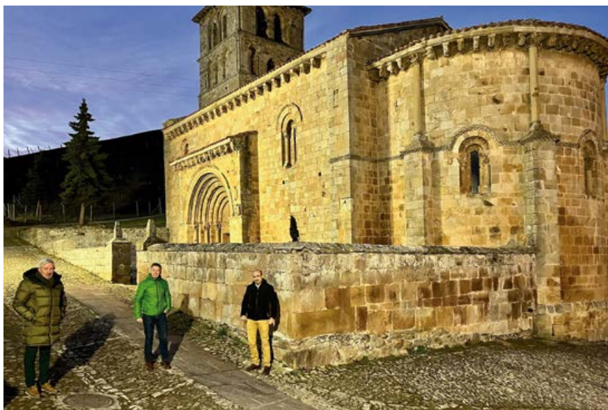
Vista nocturna de la Colegiata

El objetivo de las obras ha sido potenciar la visibilidad e identificabilidad de la Colegiata en horario de noche. La instalación parte del alumbrado público existente, soterrando el nuevo cableado por una propiedad privada, calle pública y el jardín situado justo enfrente del acceso principal, donde se han colocado tres báculos que soportan los cuatro focos LED de 200 vatios cada uno, dirigidos al monumento. Se trata de una actuación que trata de aumentar la puesta en valor del bien sin causar alteración física al entorno e iluminando de forma discreta los