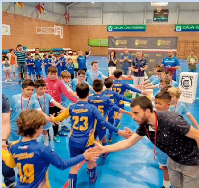
Momento de la final de Copa celebrada en Matamorosa

hasta varios inscritos de más de 80 años. Una vez finalizada la marcha todos pudieron disfrutar en zona de Salida/Meta de hinchables para los más pequeños y lunch. Supero todas las expectativas de la organización con 700 inscripciones.