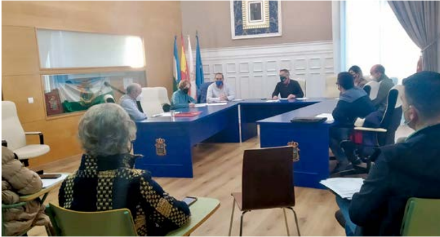
Momento del debate plenario sobre la sanidad

El Pleno del Ayuntamiento de Campoo de Enmedio aprobó por unanimidad la presentación de una moción conjunta dirigida a la Consejería de Sanidad para que ponga fin a los graves problemas médicos que afectan a la comarca.