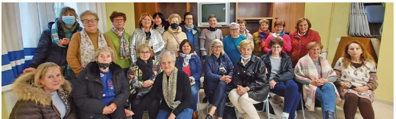
Participantes en uno de los talleres

Con los objetivos de dinamizar la vida social del municipio y prestar los servicios asistenciales a los vecinos, el Consistorio organizó varios talleres a lo largo del año, dividiendo sus sedes entre Matamorosa y Nestares para facilitar el acceso de todos los pueblos a estos talleres.