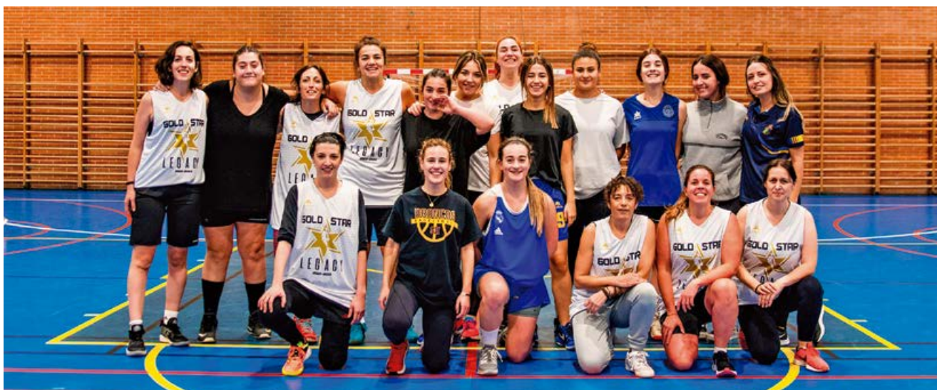
Participantes en el encuentro

Agradecer también a los numerosos mensajes, WhatsApp y llamadas de exjugadoras, que no pudieron estar en Matamorosa por fechas u otros motivos. Como ya se anunció, se pretende repetir e intentar que el evento crezca (aunque el polideportivo de Matamorosa se nos quede pequeño).