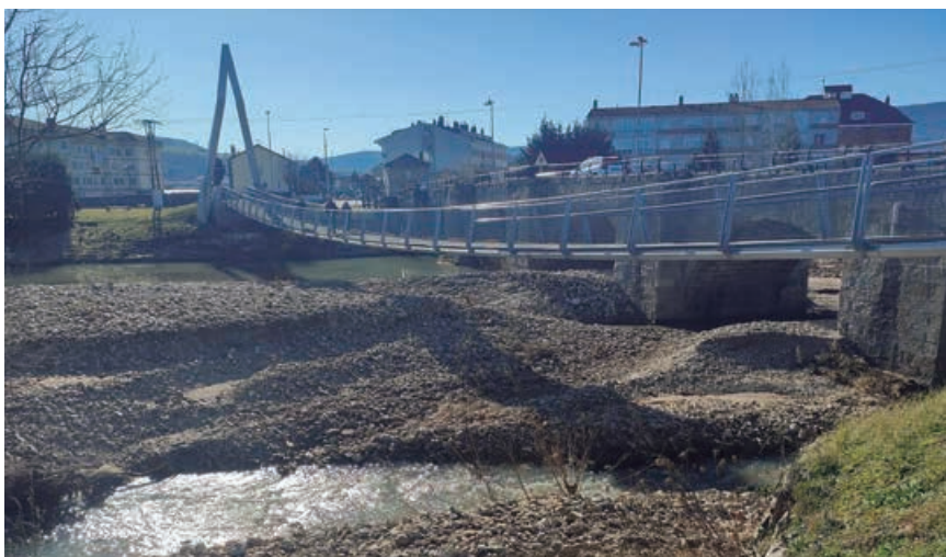
Estado del cauce del Híjar tras los acarrees sufridos por la riada

El expediente aprobado por la Comisión Informativa fue elevado a la Junta de Gobierno Local, quien aprobó la propuesta provisional motivada, publicada en el tablón de anuncios, web municipal y BOC para la formulación de alegaciones y reclamaciones. Subsanas éstas, según las bases, aprobación definitiva y pago de las ayudas, cuya orden ya está cursada.