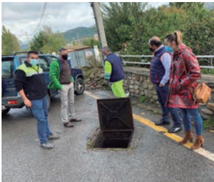
Levantamiento del acta de inicio de las obras de sustitución de la red de agua en Nestares

P revia convocatoria por parte del Gobierno Regional para la elaboración de proyectos de inversión en abastecimientos y saneamientos municipales en régimen de cofinanciación, el Ayuntamiento de Campoo de Enmedio solicitó la ejecución de la renovación de la red de agua potable de Nestares. Con posterioridad, y previa elaboración del proyecto por parte del Gobierno Regional, el Pleno del Ayuntamiento aprobó por unanimidad la primera fase de renovación integral de la red de agua de Nestares por un importe de 249.966,91 €.