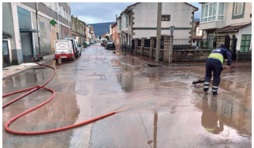
Los empleados municipales trabajaron sin descanso para restablecer la normalidad