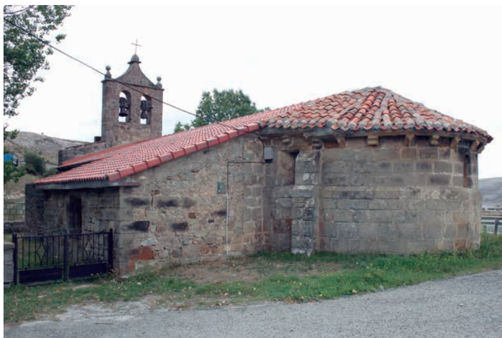
La iglesia luce un bonito ábside románico

Es el pueblo más meridional de Campoo de Enmedio, a unos 7 kilómetros de Matamorosa. Se sitúa en un estrecho valle al pie del puerto de Pozazal, delimitado por montes de perfiles redondeados muy desnudos de vegetación, a excepción del monte Matanzas, al este del pueblo, donde aparece un cerradísimo hayedo que se prolonga hasta los Carabeos.