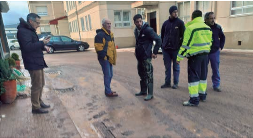
El Ayuntamiento estuvo pendiente en todo momento de las labores de limpieza

por el estado del cauce del río Híjar, interesando una limpieza rápida y en profundidad del lecho del río, advirtiéndole de su responsabilidad en caso de volverse a producir situaciones como la vivida la noche del jueves 19 de diciembre. En este sentido, Martínez apuntó, no sólo a la situación ordinaria del río, sino también y con urgencia extrema, la retirada de las numerosas toneladas de piedra, vegetación, árboles, raíces y otros materiales arrastrados por la riada, que se encuentran a lo largo del cauce del río y que pueden causar una catástrofe mucho mayor que la vivida. Además de provocar riadas, estos materiales podrían ser arrastrados hacia los puentes y hacerles colapsar. Añadió el Regidor, que el riesgo se podría multiplicar por las nevadas y deshielos. Por ello, la limpieza solicitada a Confederación debería realizarse con carácter de extrema urgencia.