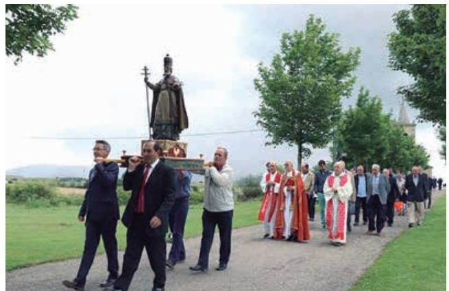
La responsabilidad obligó también a suspender las fiestas de los pueblos