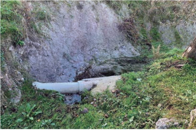
La fuerza del agua dejó al descubierto la red de desagüe