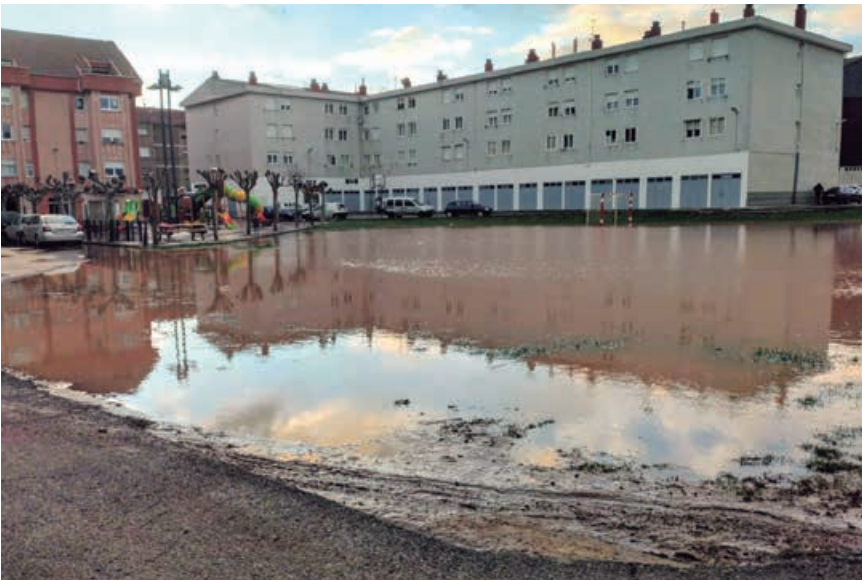
Así amaneció el barrio del Arquillo el 20 de diciembre