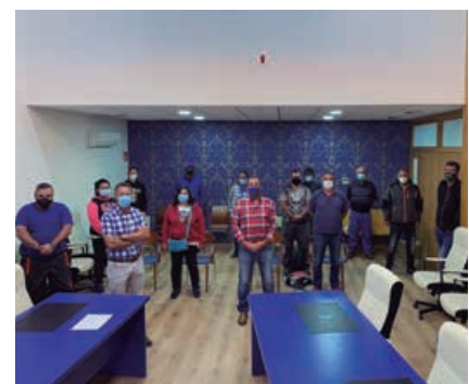
Debido a la pandemia, las contrataciones de 2020 fueron divididas en dos periodos

la realización de una preselección de candidatos para que sobre esa preselección, el propio consistorio defina los trabajadores aptos para la realización de los trabajos. En esta ocasión, y debido a la pandemia, las contrataciones se han llevado a cabo en dos periodos de seis meses cada uno, quedando fijada la finalización de los contratos el 30 de junio próximo.