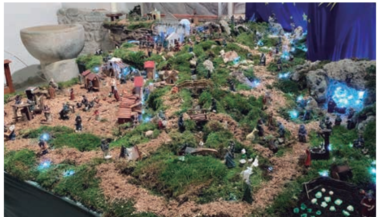
Segundo premio para el instalado en la Iglesia de Fresno