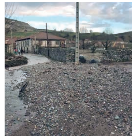
La fuerza del agua depositó la piedra de la vía en el casco urbano de Cañeda

Fue la crónica desgraciada que nos tiene que servir para meditar y concienciarnos a “todos” que