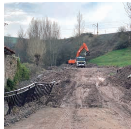
Labores de limpieza y retirada de la piedra de la vía en Cañeda

subvención, dígase viviendas habituales, tanto para propietarios como para inquilinos, reparación de vivienda habitual, establecimientos comerciales e industriales y vehículos.