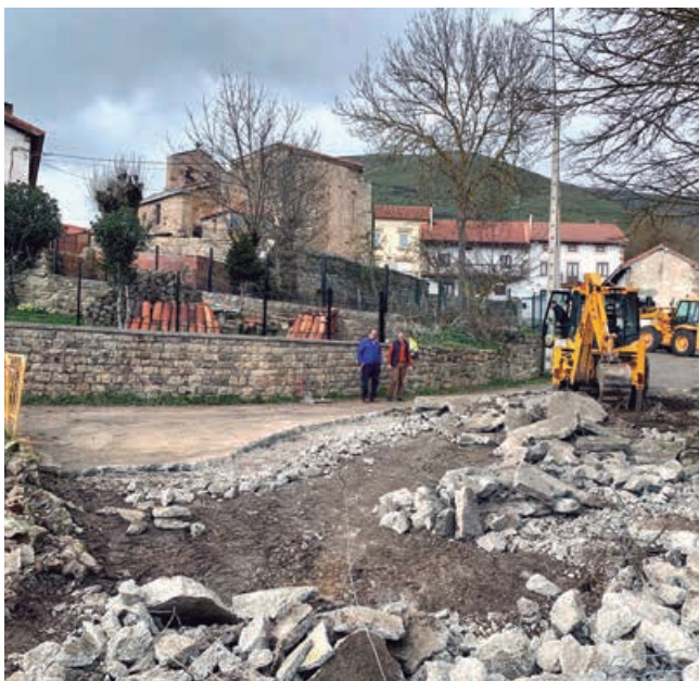
Obras en la plaza de Fontecha a causa de la riada