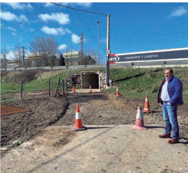
El Concejal Delegado de Obras se encuentra al frente de la brigada de Obras supervisando la inversión en mantenimiento

Con todo ello, la suma total de la inversión prevista a lo largo de 2020 en el municipio es de 1.222.850 €, y tiene en su mayor parte como destino la creación de las condiciones necesarias para el asentamiento y fijación de la población en nuestros pueblos.