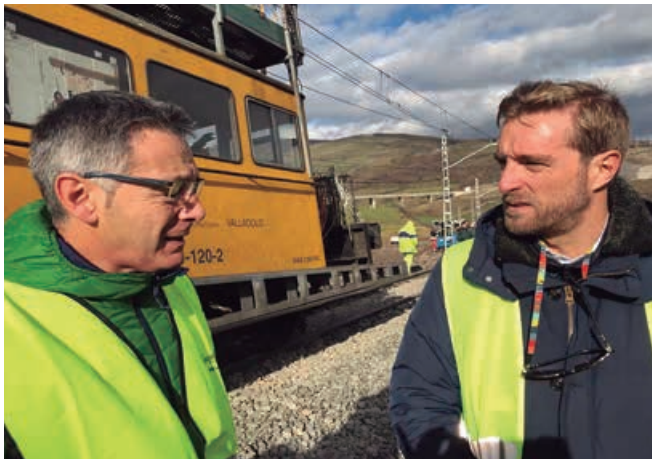
Visita del Director de Transportes a la zona afectada