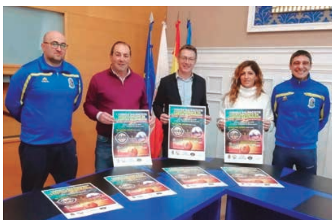
Presentación del I Torneo de Baloncesto Ayuntamiento Campoo de Enmedio