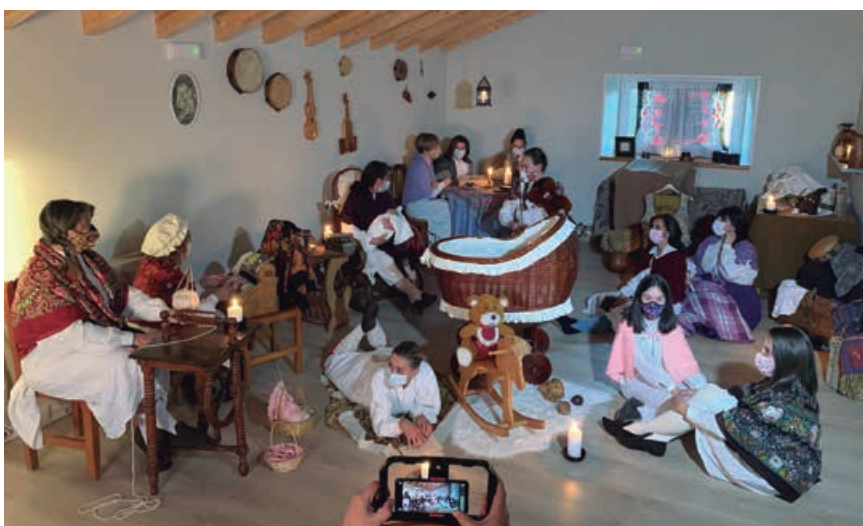
La escuela Luis García en una de sus últimas representaciones