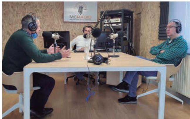
Jornada de puesta en marcha de las emisiones

Por mi parte, siento una satisfactoria mezcla de orgullo y responsabilidad. Orgullo, por haber cumplido un sueño: hacer radio en mi tierra, a la que tanto quiero. Responsabilidad, porque el reto de ofrecer un producto radiofónico variado y de calidad es mayúsculo. Soy consciente de que no hay nada más democrático que el mando a distancia. Trabajaré duro para que el 107.9 FM no se mueva de su dial. Para que las empresas perciban que la antena de Radio