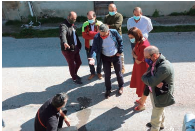
La Consejera de Presidencia visitó el municipio

Consejería y Ayuntamiento convinieron la realización de una evaluación general del municipio, de cuya comprobación se encargará el cuerpo de Bomberos de Campo. Una vez diagnosticada la situación se procederá a la adecuación de la red.