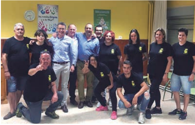
Equipo municipal con el Alcalde y el Concejal de Fiestas, responsable de su organización