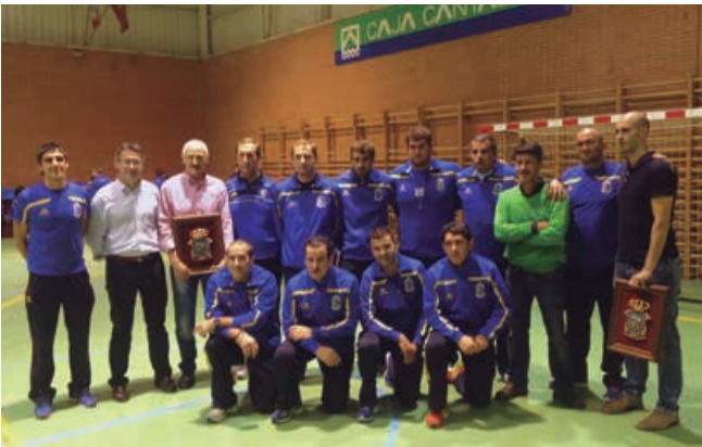
Visita de Tuto Sañudo

Reconocimiento público a dos grandes deportistas de nuestro municipio