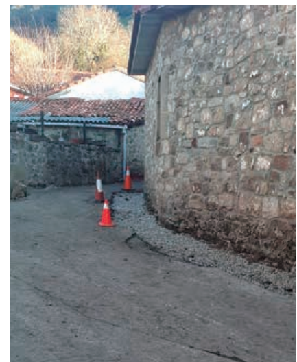
Obras de mantenimiento y drenaje en Aradillos

El Alcalde del municipio manifestó que no es el mejor momento para subir impuestos, dado que los efectos del COVID y los Estados de Alarma están creando un retroceso del consumo que es necesario paliar si queremos que la economía mejore. Países europeos, como Alemania, argumenta el regidor, están tomando este tipo de medidas para incentivar el consumo como herramienta de mejora inmediata de la economía.