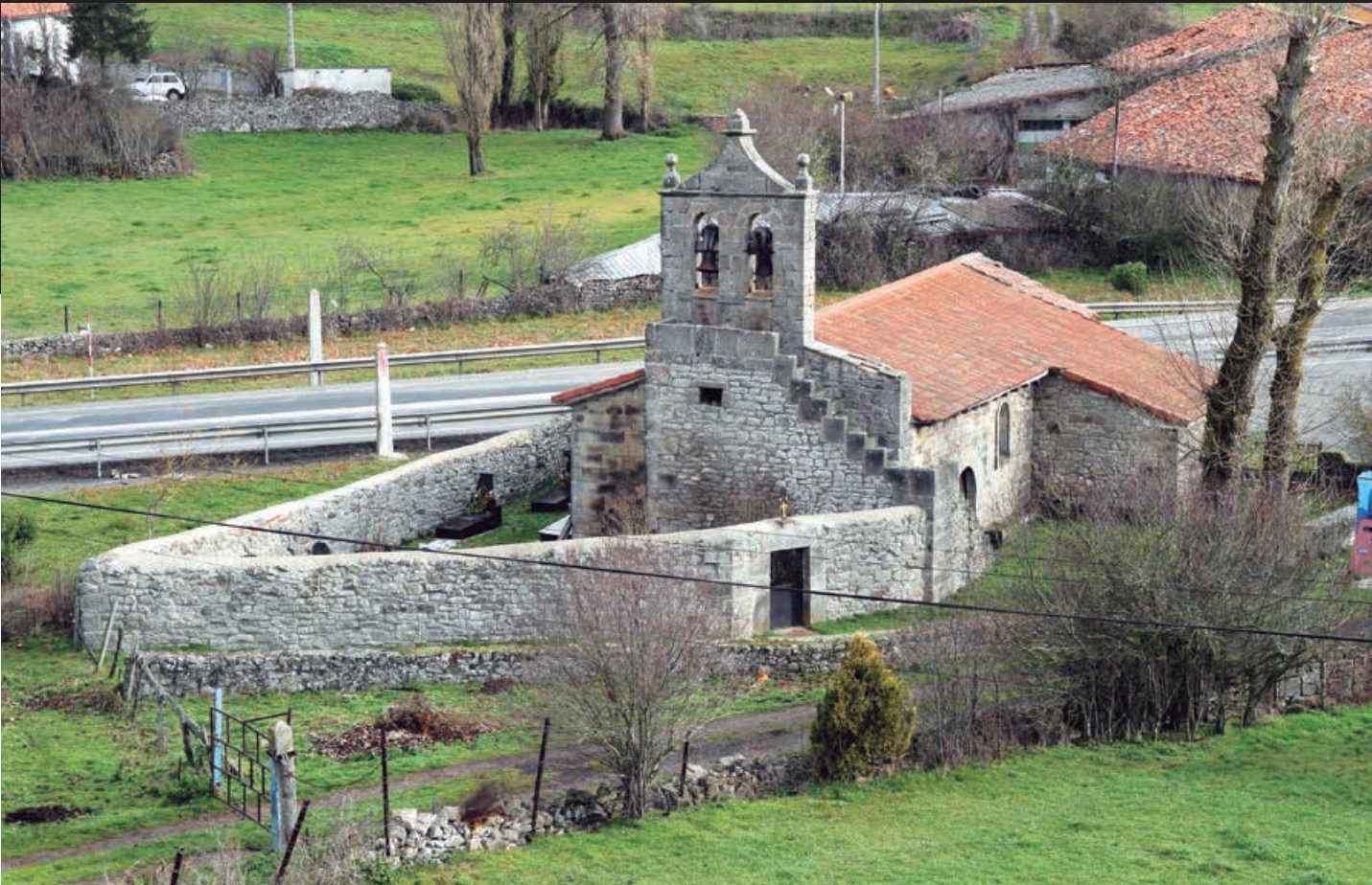
Iglesia de Fombellida, vista general