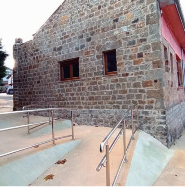
Fachada oeste del Centro Social

En cuanto a las instalaciones interiores se ha valorado desde el inicio, apostar por la mejora y la eficiencia energética del sistema de iluminación de la sala principal del local, sustituyendo las antiguas pantallas de fluorescentes existentes por unas luminarias led de gran luminosidad, bajo consumo y escaso mantenimiento. Como medidas complementarias a las instalaciones existentes se dispondrá de la implantación de un nuevo aseo y la reposición de los radiadores de aluminio como difusores del sistema de calefacción existente.