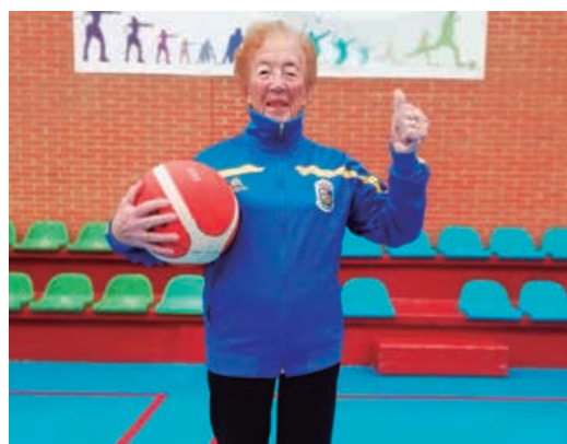
Actividades físicas para la salud desde los 18 a los 85 años

Dirigido a tod@s los vecinos con edades comprendidas entre los 18 y los 85 años, las actividades ofertadas son Gimnasia de Mantenimiento, Pilates y Actividad Física para Mayores. Se desarrollan en el pabellón municipal de deportes de Matamorosa, a excepción de la Gimnasia, que se celebra también en los locales de las asociaciones de los pueblos en los que hay un número suficiente de inscritos. En estos momentos en Requejo y Nestares. La temporada 2019/2020 participaron en el programa 96 personas.