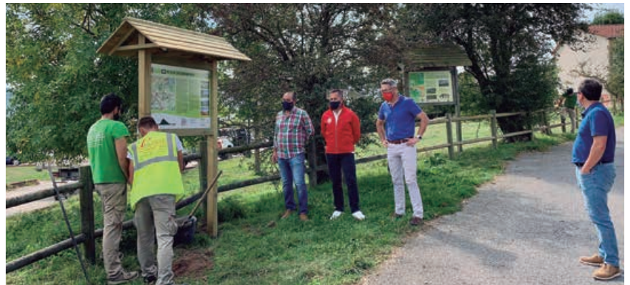
Inicio del balizamiento de los senderos

Los denominados “Camino de la Cantabria Prerromana” y “Vía Cantabrorum” recorren el sur del municipio, mientras que la “Ruta de la cueva del Moro” se desarrolla en su parte noreste y el “Nacimiento del Besaya” en su franja noroeste.