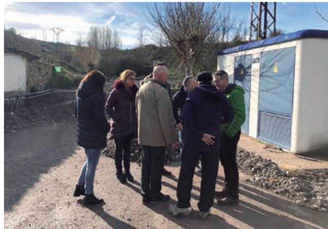
Visita del Delegado del Gobierno a Campoo de Enmedio

a quien se solicitó la intervención urgente para la limpieza de los arrastres de la vía.