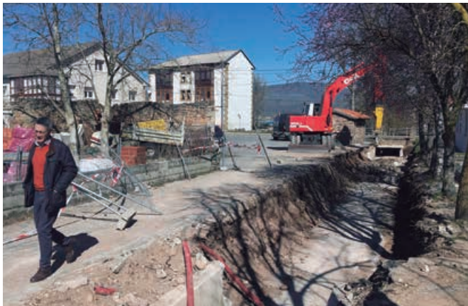
Obras de construcción de nuevo canal en Bolmir