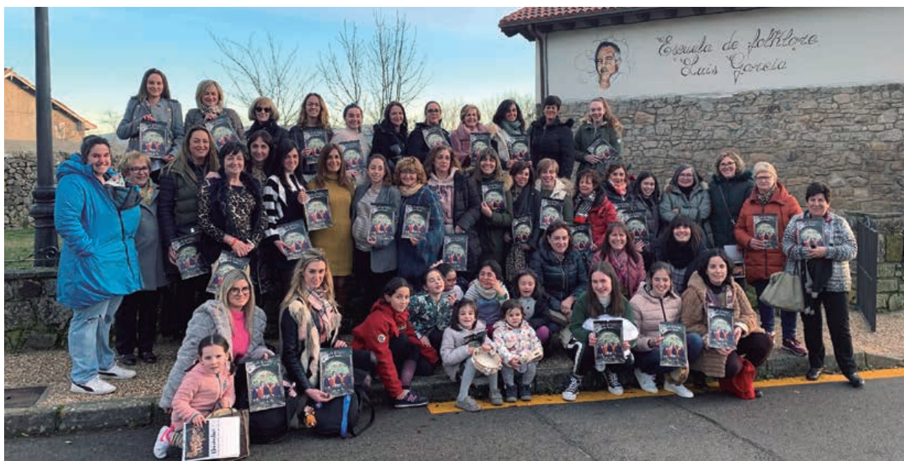
Integrantes de la Escuela de Folklore Luis García