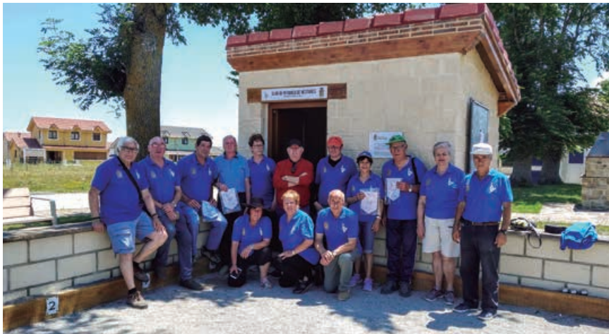
Integrantes del Club de Petanca Nestares