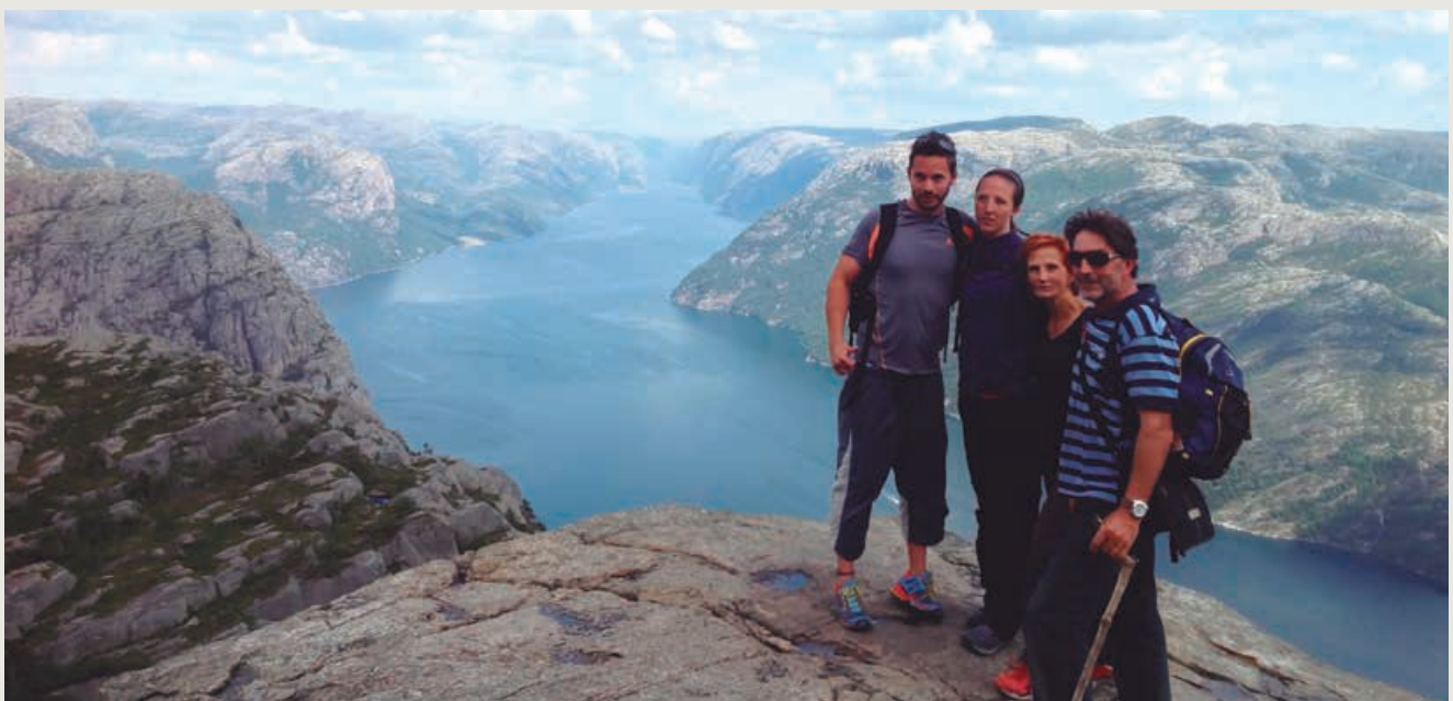
Con la familia en una de sus grandes aficiones, los viajes