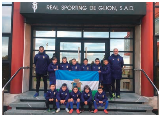
Equipo de fútbol sala infantil