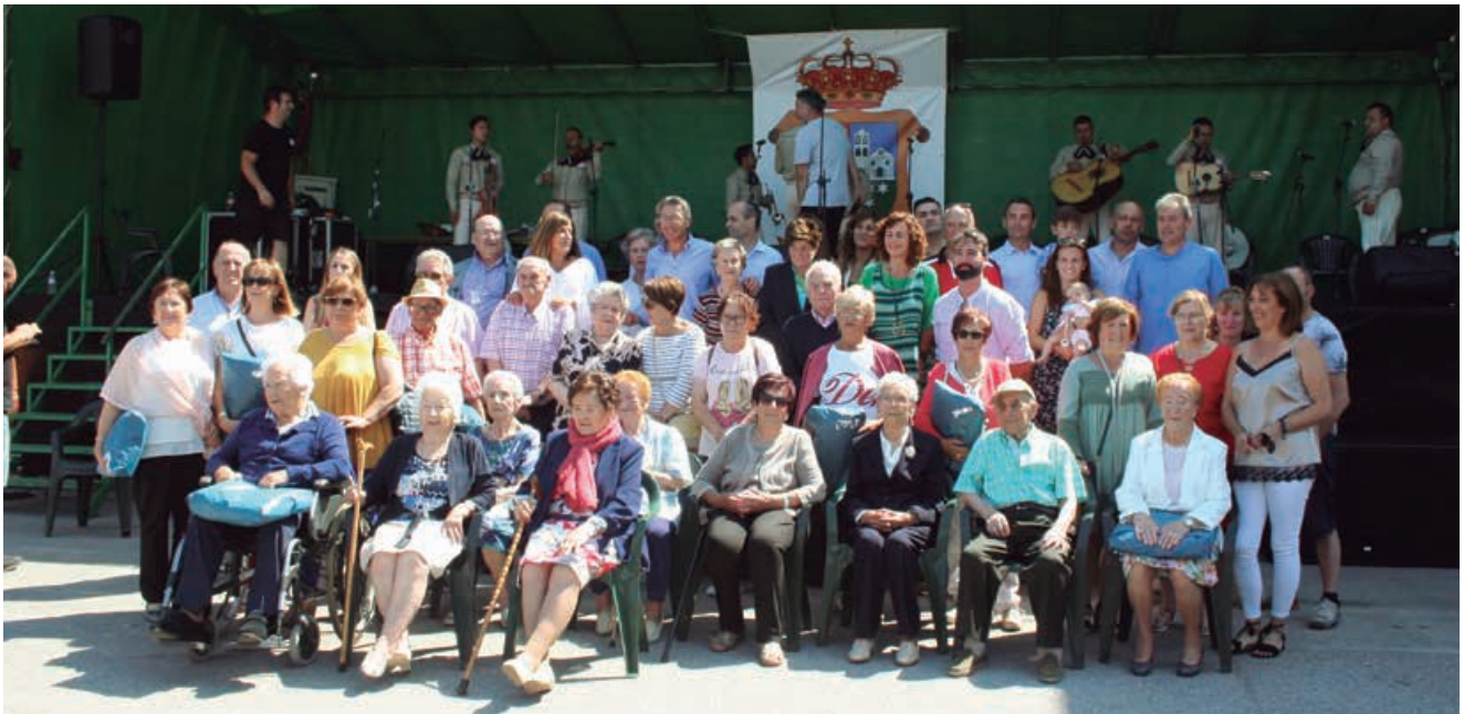
El acto central de la fiesta es siempre el homenaje a nuestros mayores

A cambio de ello el Equipo de Gobierno destinó todo el presupuesto de la fiesta a subvencionar a particulares y autónomos afectados por las circunstancias económicas derivadas del Estado de Alarma.