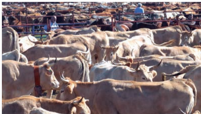
Vista general de la Feria 2019