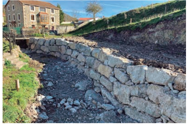
Estado después de la actuación municipal