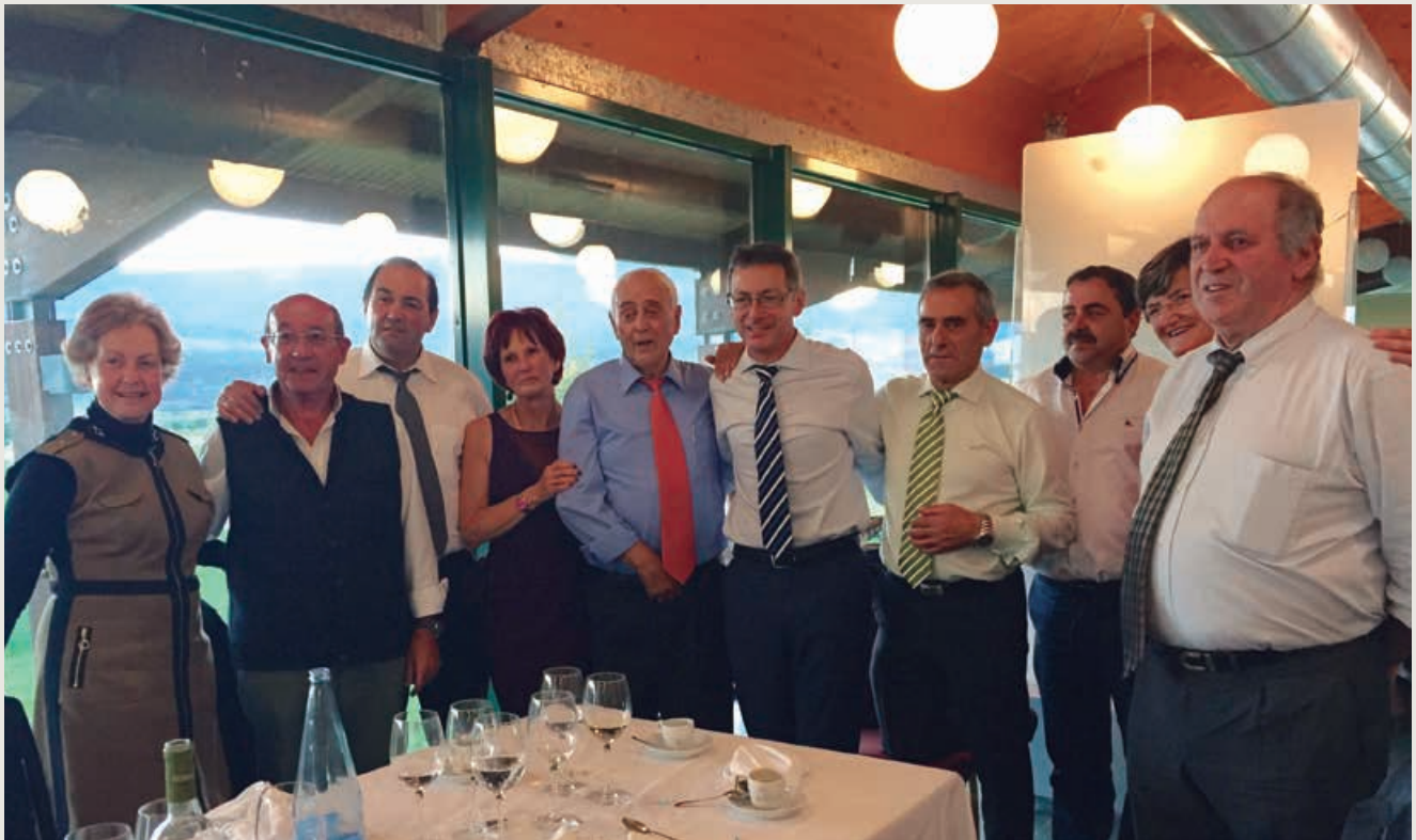
Con los dos últimos alcaldes, concejales y compañeros

Lo que he vivido dentro del Ayuntamiento de Campoo de Enmedio sería para escribir un gran libro porque el día a día de un Ayuntamiento está cargado de retos y aventuras apasionantes. He trabajado junto a políticos muy diferentes y con todos siempre he tenido un sentimiento de respeto mutuo.