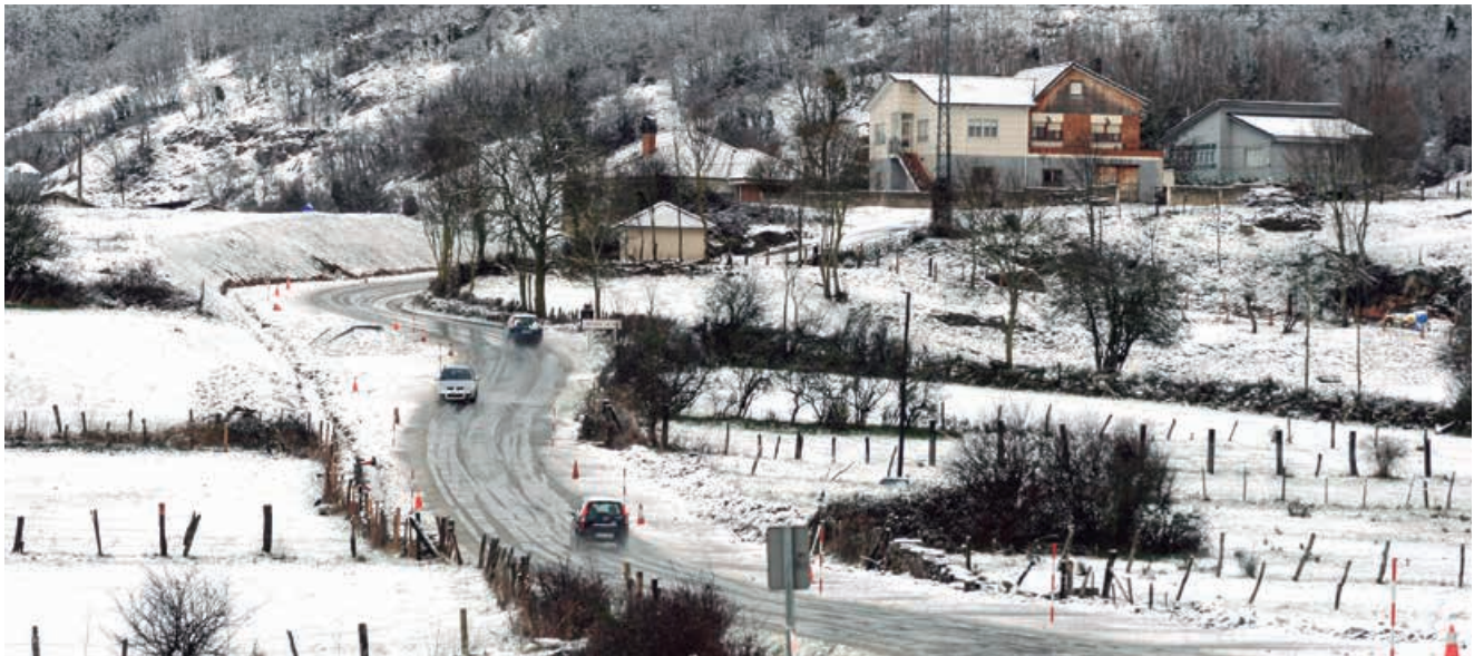
La limpieza de nieve supone una fuerte inversión debido a la dispersión del municipio