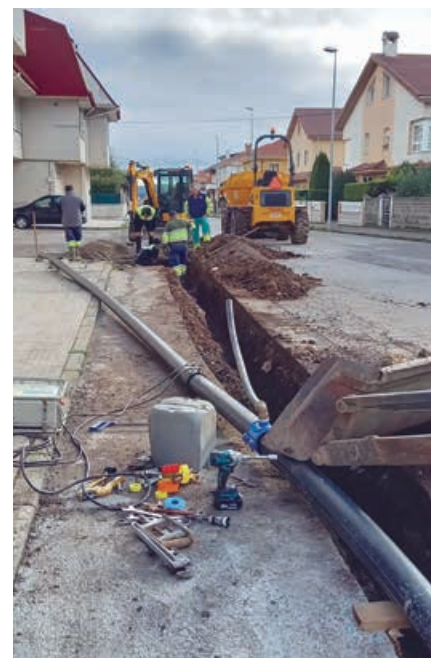
Las obras se están llevando a cabo causando el menor trastorno posible a los vecinos

Las obras serán ejecutadas conjuntamente por el Ayuntamiento de Campoo de Enmedio y Consejería de Obras del Gobierno Regional. Una vez finalizada esta primera fase, se acometerá el proyecto de la segunda y última para la renovación de toda la zona norte, la cual contará con una inversión no menor a los 500.000 €.