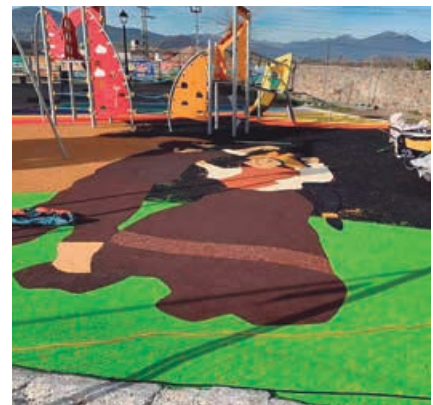
Obras de ejecución del nuevo parque infantil Casimiro Sainz, en Matamorosa

El regidor municipal agradece de nuevo la colaboración de la Consejería de Obras con el municipio y manifiesta que este proyecto, además de dar continuidad al programa de renovación de parques infantiles comenzado hace dos años, conseguirá mejorar y actualizar un entorno urbano de diversión infantil, creando a su vez un espacio de comodidad para los padres y acompañantes que les permitan estar cerca de los pequeños y disfrutar del tiempo libre.