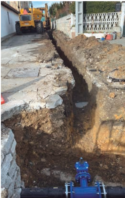
Ramal de enlace a Ciella

La obra que figura en la Ley de Abastecimiento y Saneamiento ha sido adelantada en el programa de inversiones mediante la cofinanciación entre ambas administraciones, Consejería de Obras y Ayuntamiento, al 60-40 % respectivamente.