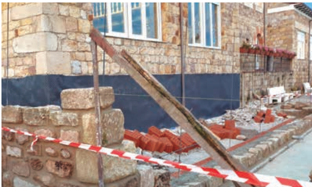
Obras de construcción de nueva terraza en el Centro Social de Requejo