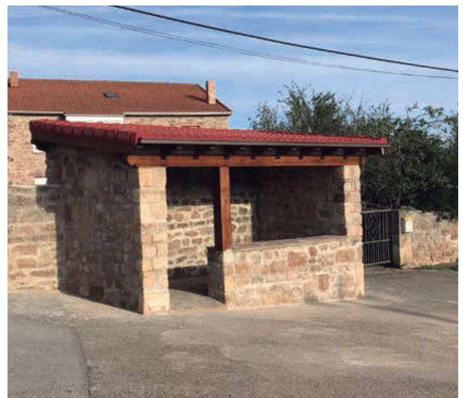
Nuevo refugio de Villaescusa efectuado por la plantilla del Ayuntamiento