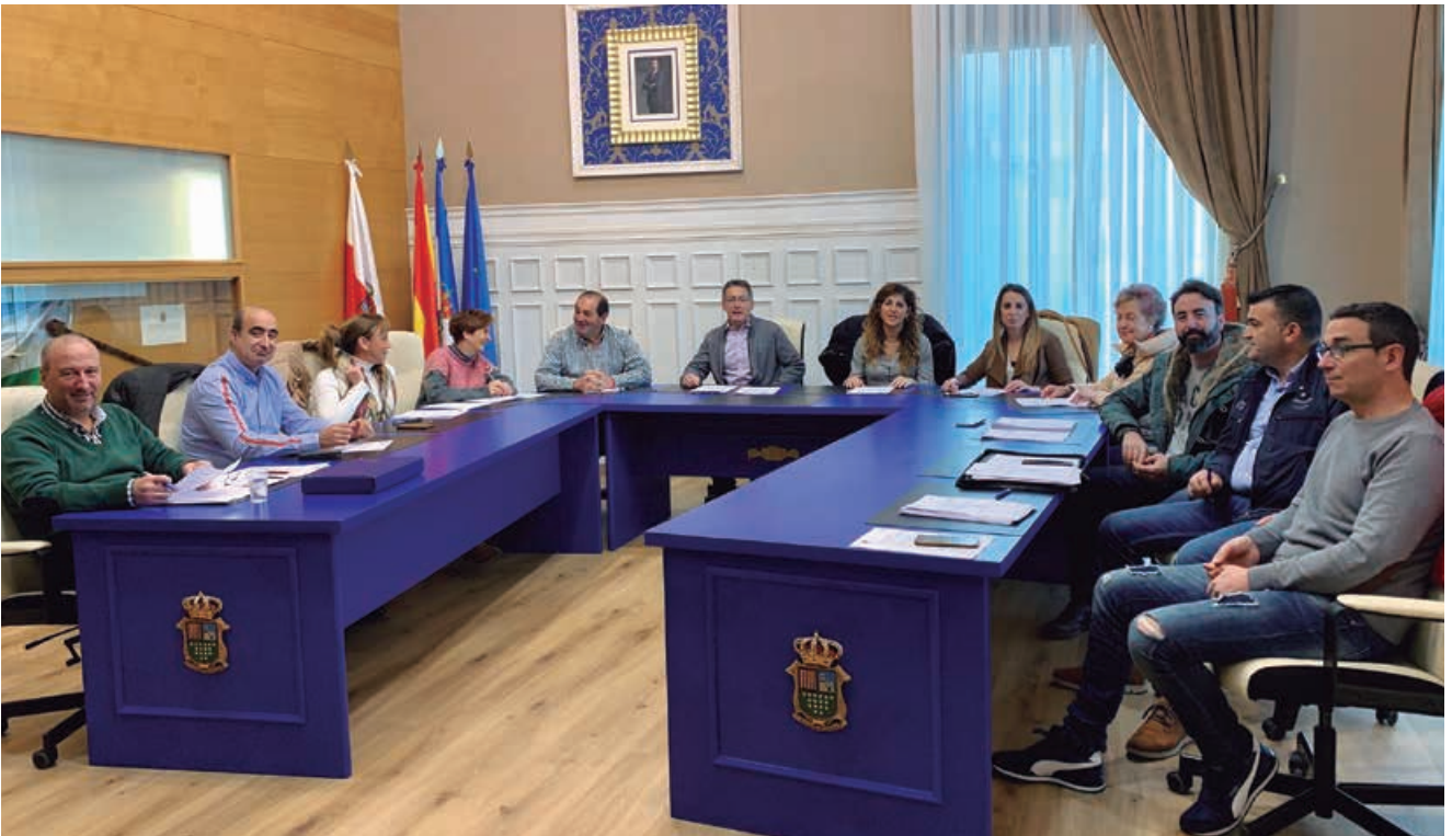
El Pleno aprobó el presupuesto 2020 con el voto a favor de populares y regionalistas y el voto en contra del partido socialista.