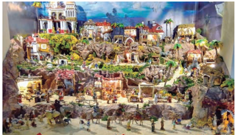
Belén ganador instalado en la Iglesia de Cañeda