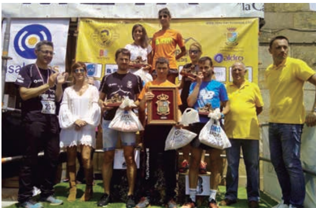
Tampoco pudo celebrarse el Trail Pico TV