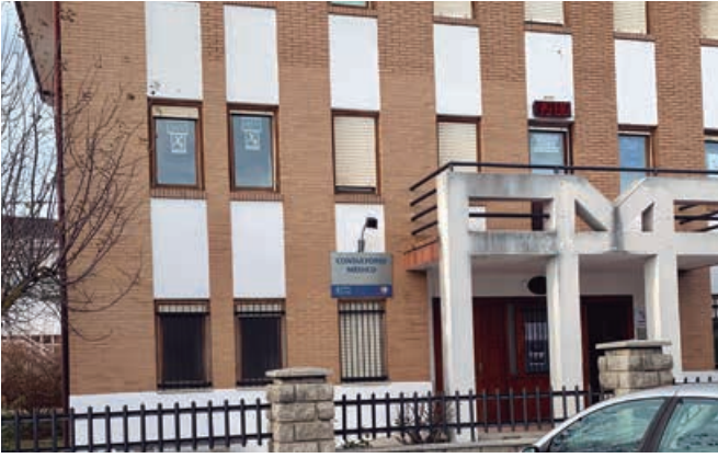
Consultorio médico de Matamorosa