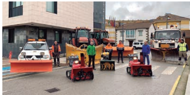
Presentación del equipo integrante del Plan Invernal 2020

Finalmente, el Ayuntamiento ha adquirido dos máquinas quitanieves tipo oruga al objeto de despejar la nieve de las aceras lo más rápido posible y mejorar la seguridad vial de los viandantes.