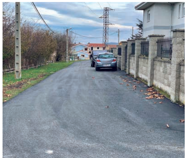
Pavimentación en Nestares

Concretamente, una de las calles de Matamorosa afectadas por el desbordamiento del Híjar, así como por las condiciones climatológicas, presentaba un estado de pavimento deteriorado, con roturas, grietas, cuarteos y deformaciones producidas por hundimientos y blandones. Esta calle se fresó completamente para mantener la rasante actual, procediendo a su aglomerado de forma continua.