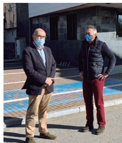
Puesta en marcha del proyecto WiFi4EU

La red se denomina WIFI_ENMEDIO y una vez efectuada la conexión en uno de los puntos, el dispositivo es reconocido en el resto de localizaciones. Es de fácil conexión a través de cualquier dispositivo y no necesita contraseña. Esta iniciativa ofrece un paso más a la instalación llevada a cabo en fechas recientes en