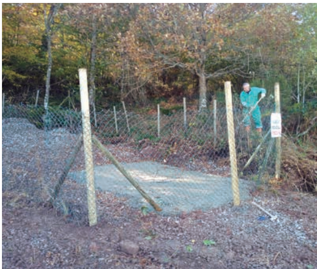
Mejora del manantial de Villaescusa

Las obras solicitadas por el Ayuntamiento debido a la peligrosidad e inundaciones que presentaba la zona han sido financiadas por la Consejería de Obras y Vivienda con un presupuesto base de licitación de 174.828 euros y un plazo de ejecución de seis meses.