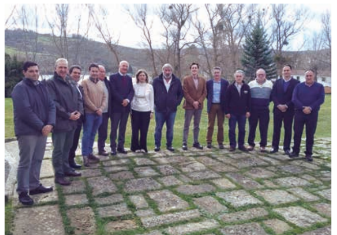
Reunión con la Presidenta de la Confederación Hidrográfica del Ebro en Arroyo

el informe definitivo para prevenir avenidas en el Híjar, Izarilla y Ebro. Según Confederación, en los próximos meses comenzarán a ponerse en práctica las primeras medidas.