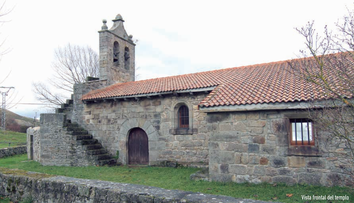
Vista frontal del templo