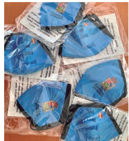
Último reparto de mascarillas reutilizables

La mascarilla lleva el nombre del municipio con una serigrafía alusiva al patrimonio de su entorno, sin renunciar a una protección altamente eficaz. Una mascarilla reutilizable y homologada según normativa UNE -0065, UNE-0065:2020 e ISO6330, hecha con tejido sanitario certificado. Presenta una eficacia a filtración de partículas del 96 % y aerosoles del 98 %. En cuanto a respirabilidad y