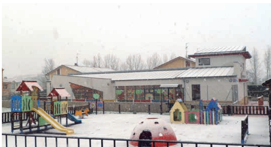
Exterior de la Escuela Infantil El Bosquecillo

En su octavo año de andadura, la Escuela Infantil Municipal de Campoo de Enmedio inició un curso diferente, marcado como en todos los colegios, por la pandemia.