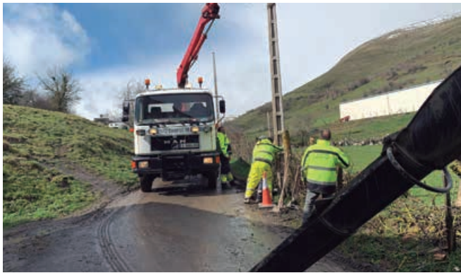
El capítulo II soporta todas las obras de mantenimiento.