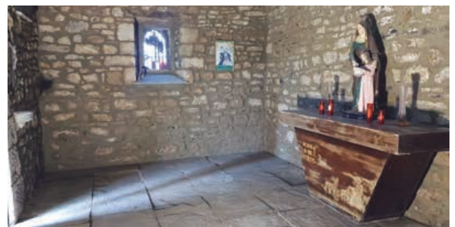
Interior de la ermita remozada

su mejor conservación. Posteriormente se ha limpiado la piedra para realizar su rejunteo.