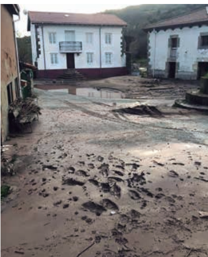
Estado de la plaza de Cañeda después de la riada