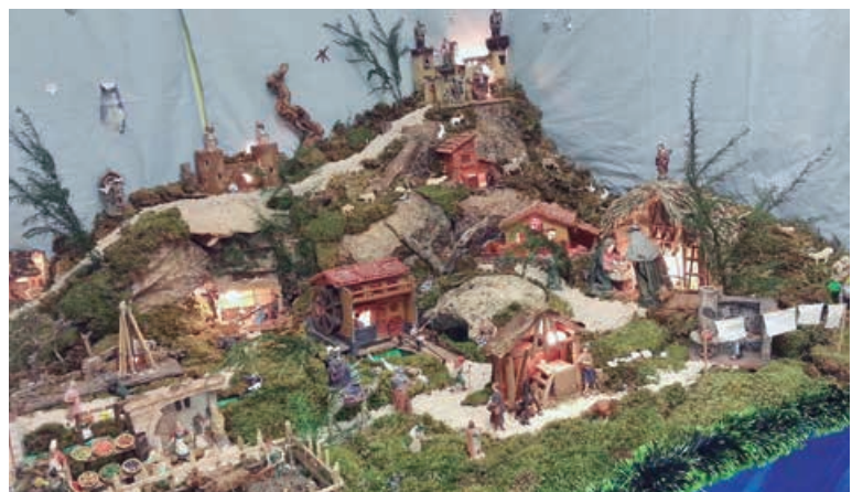
El tercer premio fue para la Asociación de Vecinos de Nestares