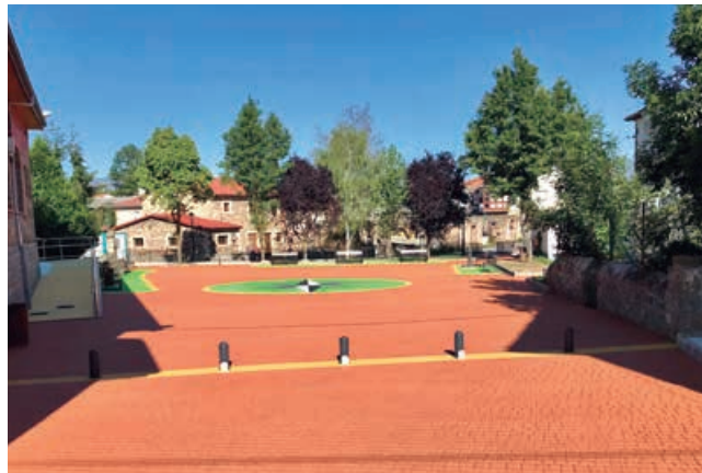
Rehabilitación integral de la zona de la plaza de Bolmir

con asfalto impreso, lo que ha proporcionado un acabado y aspecto adoquinado al tratamiento. Por otro lado, se ha demolido el canal existente en el arroyo La Cuesta y su nueva ejecución en canal fundamentalmente abierto y adaptado a los criterios de inundación para espacios urbanos de la Confederación Hidrográfica del Ebro.