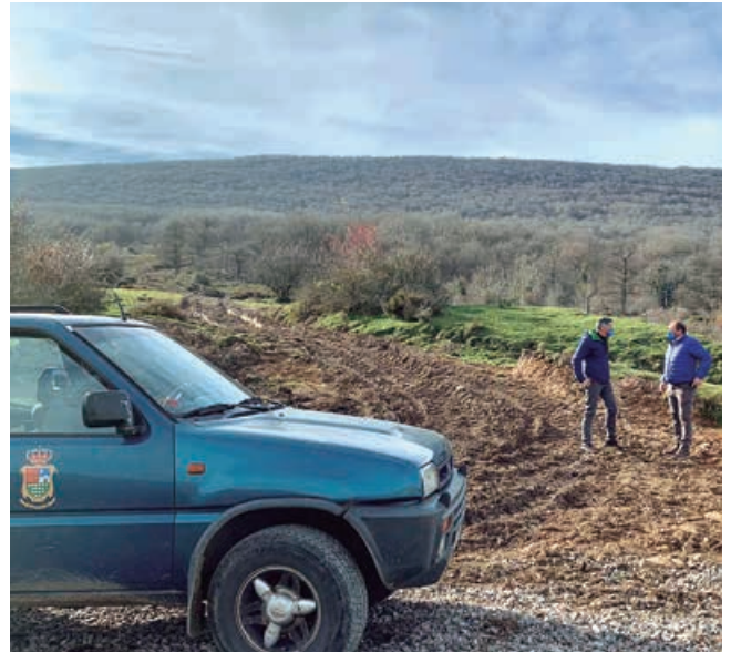
Obras de conexión del manantial con el depósito de Villaescusa

El Consistorio de Campoo de Enmedio continúa de esta forma, regularizando la gestión del agua potable en el municipio, donde el Ayuntamiento ya gestiona los pueblos de Matamorosa, Nestares, Requejo, Bolmir, Fresno del Río, Retortillo, Cervatos, Celada, Aldueso y Villaescusa. A finales del presente mes se incorporarán Cañeda y Horna de Ebro, siendo prioritaria a lo largo de la presente legislatura la incorporación de los demás pueblos, con el objetivo de regularizar el total de núcleos.