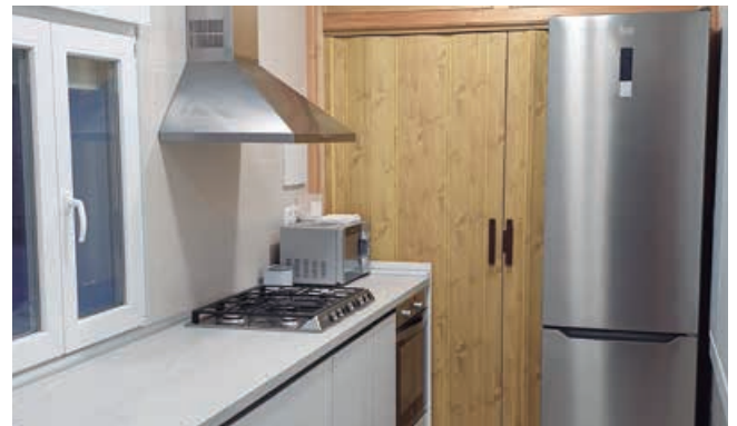
Dotación de cocina al Centro Social de Requejo

A lo largo del año se llevaron a cabo importantes obras de mejora y acondicionamiento en el Centro Sociocultural de Requejo.