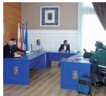
Reunión con la dirección de Forgings &amp; Castings en el Ayuntamiento

llevar a cabo el proyecto, trasladó a la empresa las diferentes zonas disponibles para su desarrollo.