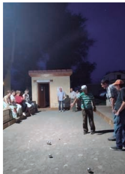
Noches de verano en la petanca

Poco a poco iremos desgranando los fundamentos y objetivos de todas ellas. Este primer año serán las Asociaciones de Nestares y Fresno del Río quienes nos expongan sus respectivos puntos de vista.