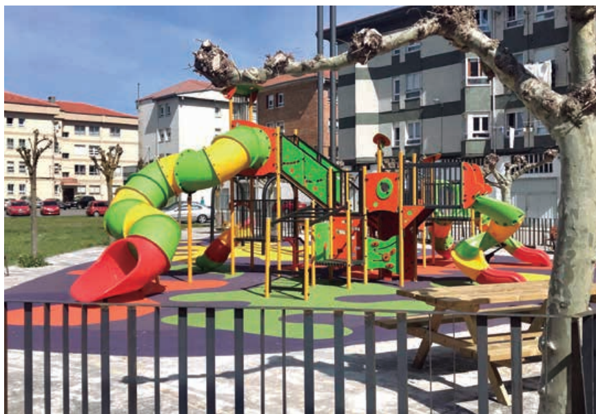
El Ayuntamiento desinfecta diariamente los parques

A partir de su apertura se está procediendo a la desinfección diaria de las zonas de juego de acuerdo a la normativa existente. Para ello el Ayuntamiento ha adquirido ya tres mil litros de producto certificado.