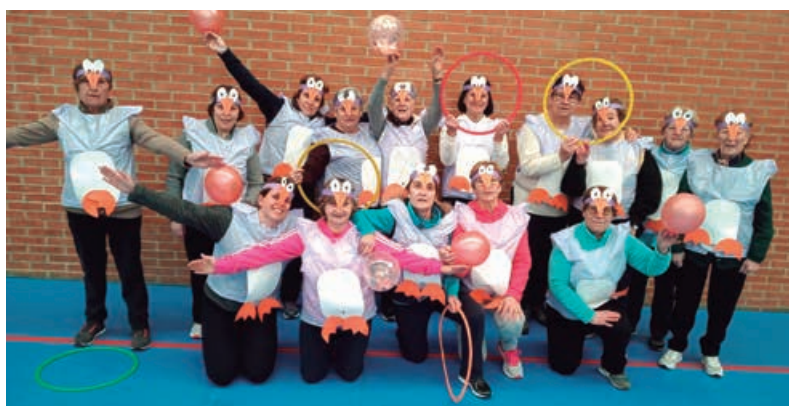
Grupo de actividades físicas para la salud