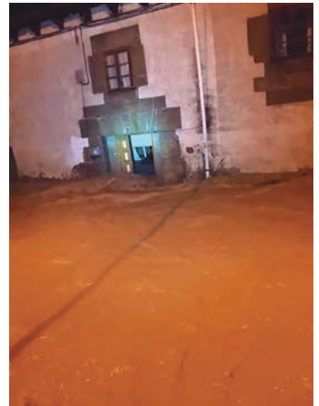
Cañeda sufrió el alivio de las aguas del Ebro a través del túnel del ferrocarril.