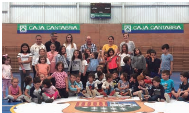
La prudencia obligó a suspender las diferentes ludotecas

La responsabilidad con los más pequeños ha sido el motivo principal de la suspensión de las diferentes ludotecas a lo largo de 2020. Esperemos que a partir de la próxima primavera cambien las cosas y podamos volver a la normalidad.