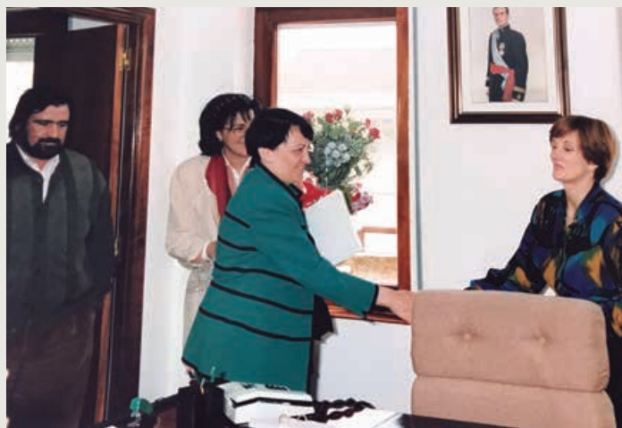
Etaapa como Secretario-Interventor en Campoo de Enmedio

en casa, para seguir los estudios que me apasionaban.