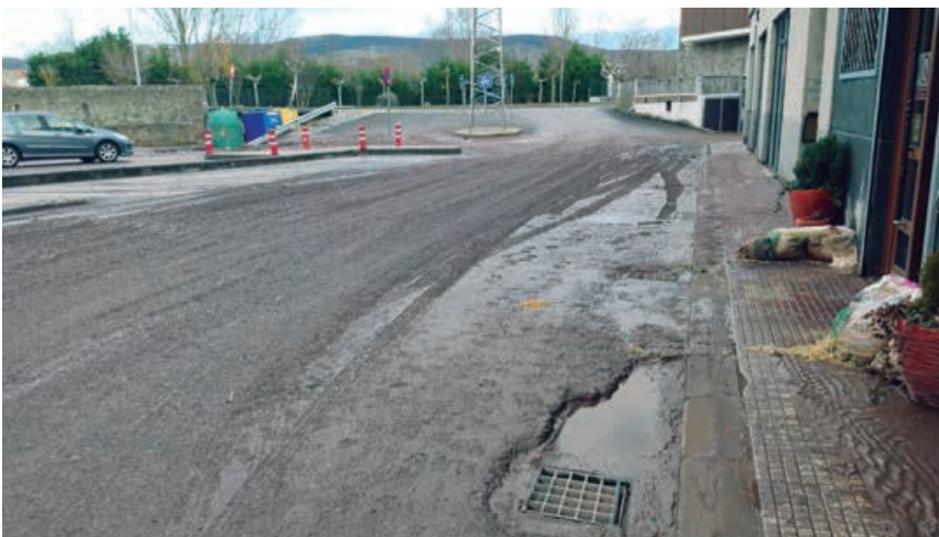
El barro cubría todas las calles.

Por otra parte, el Equipo de Gobierno propuso la tramitación de una queja a Confederación