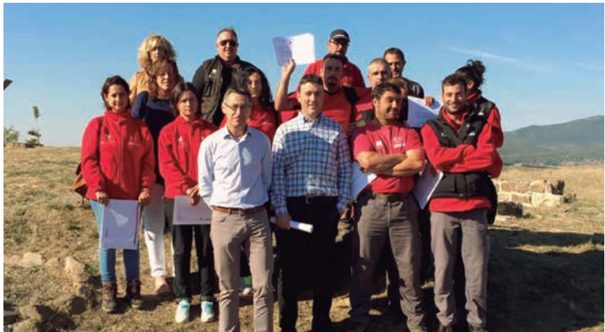
Programas de prácticas y mejora de la empleabilidad para jóvenes, promovidos por el ayuntamiento

El ayuntamiento pretende destinar estas contrataciones para poner en