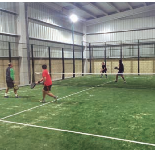
Nuevas pistas de pádel cubiertas en Nestares