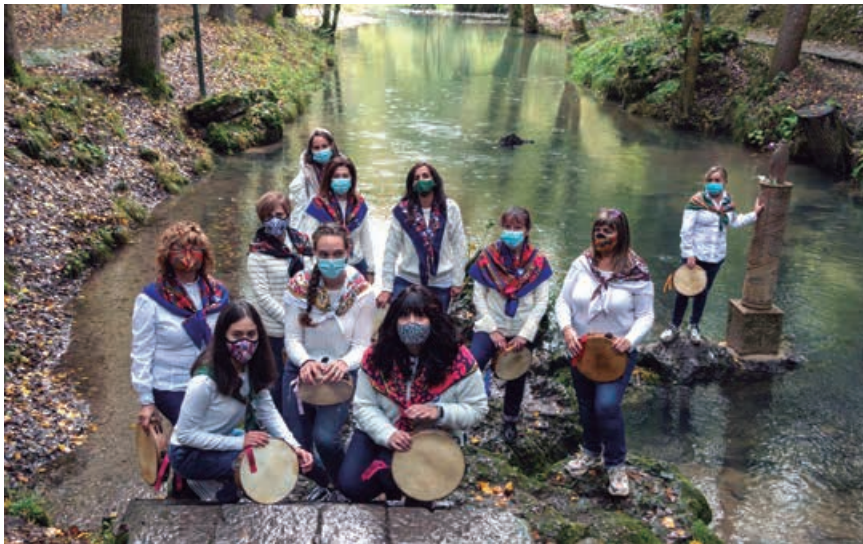
El Grupo de Verano en el nacimiento del Ebro