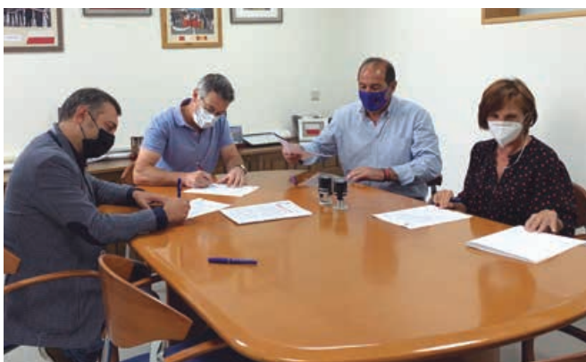
Acto de firma del contrato de la primera emisora municipal de Campoo de Enmedio