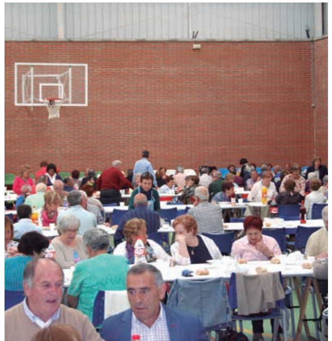
Unos 250 socios de todas las asociaciones del municipio se reúnen en la comida de hermandad

Tampoco pudo llevarse a cabo la tradicional Fiesta de las Asociaciones que suele celebrarse a lo largo del mes de junio.