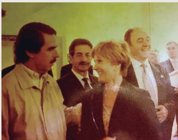
Uno de esos momentos emotivos. Con el Presidente José María Aznar en la inauguración de uno de los tramos de la autovía