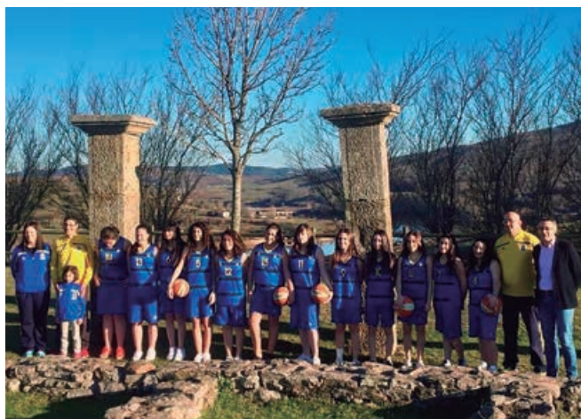
Equipo de baloncesto en Julióbriga después de proclamarse campeonas