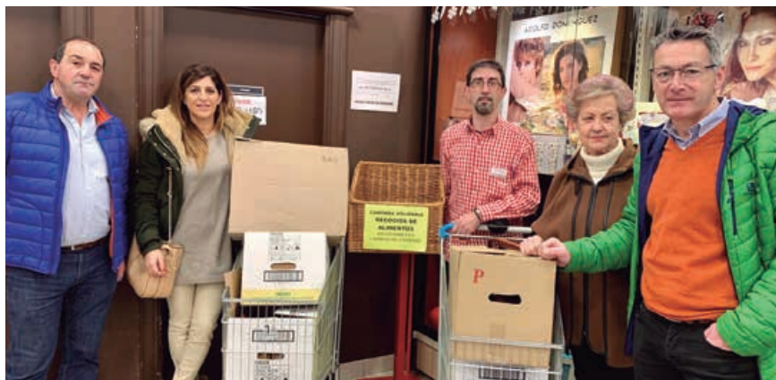
La Cooperativa San Sebastián colabora desde el primer momento con el proyecto de Comida Solidaria

D ada la grave crisis sufrida a principios de la década se decidió abordar el tema de familias con carencias para solventar o contribuir a solventar la situación. Así, desde el Equipo de Gobierno, los Servicios Sociales y en su momento la Parroquia de Matamorosa y un grupo de voluntarios, se puso en marcha el proyecto de comida solidaria.