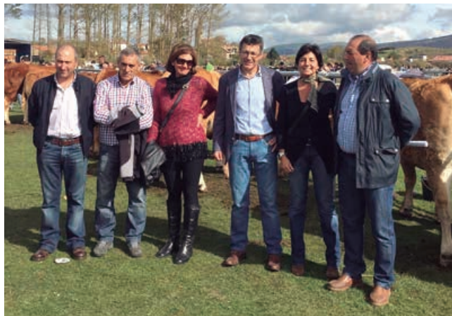
En 2019 recibimos la visita de la Directora General de Ganadería. En la foto con el Alcalde, Concejal de Ganadería y otros ediles

El Concejal de Ganadería y primer teniente de Alcalde, añadió que, al igual que el presupuesto destinado a fiestas, el montante de la feria pasará a engrosar la disponibilidad presupuestaria del Ayuntamiento dedicada a ayudas a autónomos, pequeñas empresas y trabajadores afectados por las duras condiciones económicas impuestas por la pandemia y el confinamiento que trajo consigo el Estado de Alarma.