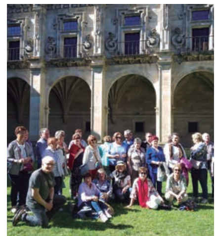
Las excursiones son actividades habituales en todas las asociaciones del municipio

Gracias a todos, y a seguir trabajando, para que desde cada una de las distintas asociaciones mejoremos la calidad de vida de nuestros vecinos y su unión a través de ellas.