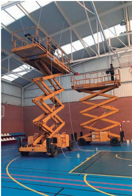
Instalación de calefacción en el polideportivo