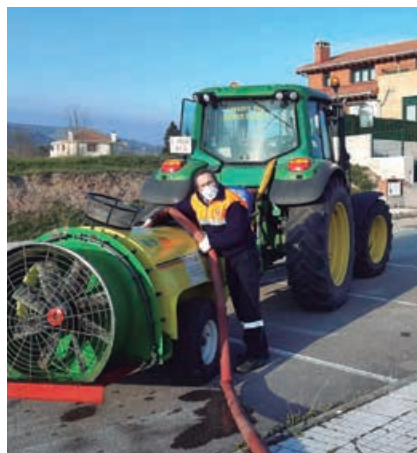
La desinfección se llevó a cabo en todos los pueblos a lo largo de todo el confinamiento

Desde los Servicios Sociales se contactó con los responsables de Protección Civil para poder llevar a cabo dicha misión. En un principio se recibieron a través de la concejal del área como referencia para que facilitase los domicilios ya señalados. Dicho servicio perduró hasta la finalización del curso escolar.