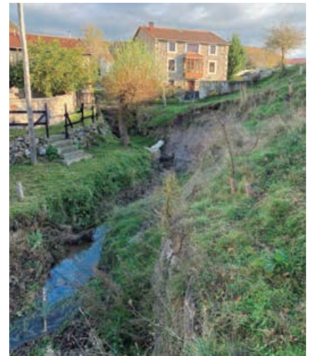
Estado en el que quedó el arroyo Merdero después de las riadas

El arroyo Merdero tiene un flujo estacional que nace en Fontecha y recoge las aguas de una extensa cuenca. Esto supone que en tiempo de desnieve se produzcan grandes avenidas con los consiguientes daños aguas abajo hasta su desembocadura en el río Ebro a la altura de la Residencia San Francisco.