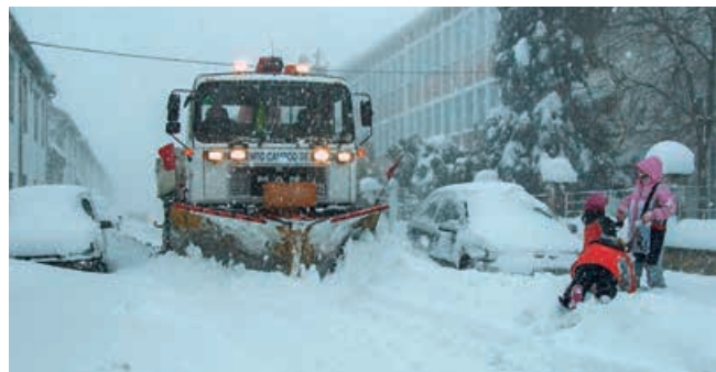
Los empleados municipales son el principal activo en la lucha contra la nieve