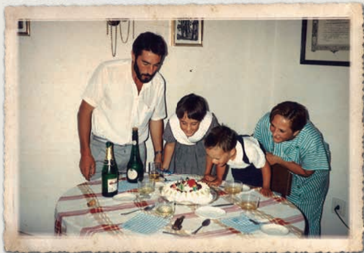
Se estableció en Campo de Enmedio donde creó su familia

Mi carácter aventurero y luchador, unido al apoyo incondicional de todos los míos, hicieron que no dejara pasar la oportunidad y que no mirase para otro lado, quedándome