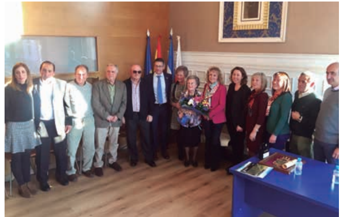
En las últimas ocasiones nos acompañó la Vicepresidenta del Gobierno Regional (arriba izda.). Confiamos que a lo largo de 2021 pueda darse continuidad a este acto tan entrañable (arriba dcha.). Momentos emotivos del homenaje a la Mujer del Año (abajo izda.). Momentos para el recuerdo (abajo dcha.).