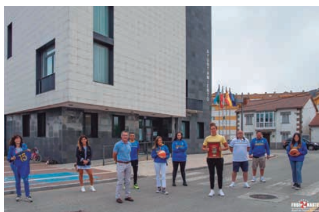
Ya son habituales las visitas de deportistas de élite