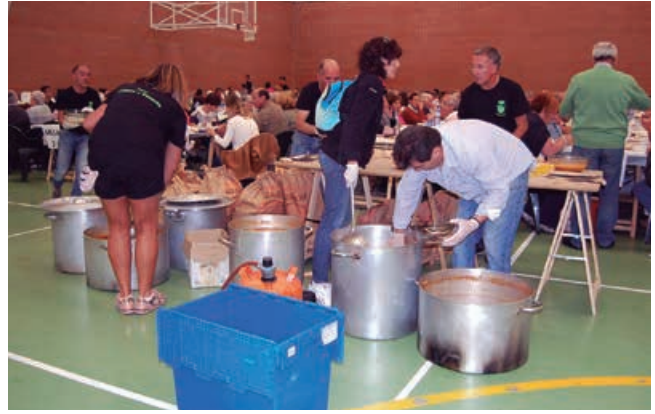
Reparto del cocido

Pero lo que más echamos en falta fue el homenaje a nuestros mayores. Una decisión difícil en la que primó, por encima de todo, la seguridad de esas personas a las que tanto debemos.