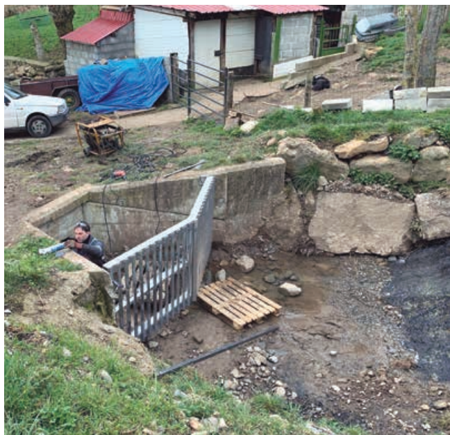
Ejecución de nuevo sistema de retención a la entrada de la plaza de Fontecha