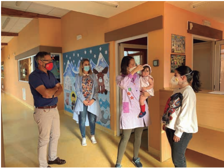
Las técnicas dispensan un trato individualizado a los alumnos

Las entradas y salidas serán escalonadas e individuales, adaptándolas a las necesidades de las familias y al número de horas contratadas. Una vez dentro del centro las técnicas realizarán la desinfección de manos y cambio de calzado a los pequeños por unas zapatillas cómodas de uso exclusivo, que permanecerán en el centro durante todo el año.