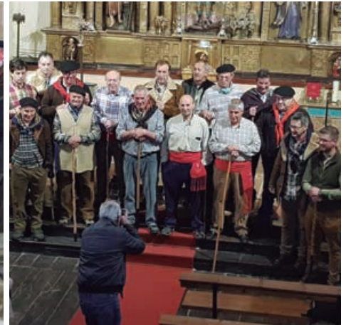
Las marzas se volvieron a cantar en Retortillo (arriba izda.). La Asociación de Rabelistas actuó en Cañeda y Bolmir (arriba dcha.). La Ronda La Esperanza cantó en la Residencia, Matamorosa y Requejo (abajo izda.). El Ligerucu después de la actuación (abajo dcha.).