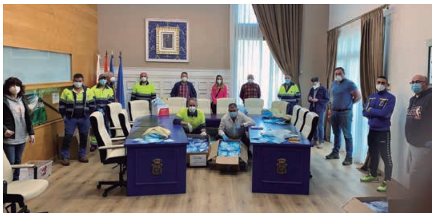
Primer reparto de mascarillas a domicilio efectuado por los empleados municipales

a lo largo del confinamiento, resolviéndose tres altas urgentes con carácter provisional y otras dos definitivas. Hubo un seguimiento del abastecimiento por parte de la empresa del material sanitario esencial para que las auxiliares pudiesen realizar su trabajo en condiciones adecuadas a la situación y se agilizó el cobro mensual de las facturas correspondientes a dicho servicio por la totalidad de las horas asignadas con normalidad a cada usuario. Así mismo, se aumentó el tiempo de servicio en algún usuario en situación especial de aislamiento sin familia cercana.