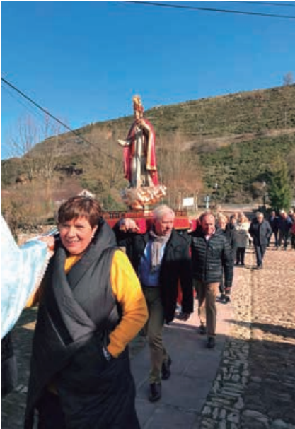
Sin embargo, pudieron celebrarse San Blas y Santa Águeda, al ser su fecha anterior a la declaración del Estado de Alarma