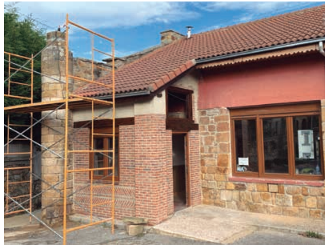
Rehabilitación y ampliación del Centro Social de Bolmir

Se ha dispuesto de un cerramiento de fachada mixto conformado por una fábrica de ladrillo cara vista y otro lienzo de ladrillo para revestir con mortero de cemento que posteriormente será pintado. Se incluye una nueva puerta principal de entrada de PVC y dos pequeños elementos de carpintería de PVC y madera, que garantizan una cierta iluminación natural del espacio de acceso.