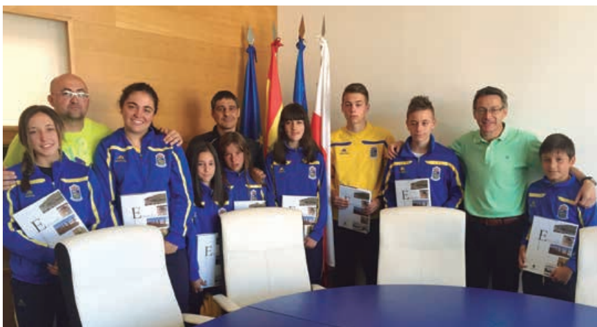
Recepción a los seleccionados por la Federación Cántabra

Varios de los jugadores de las Escuelas Deportivas fueron seleccionados para participar con la Selección Cántabra de Selecciones en el Campeonato de España gracias al gran rendimiento demostrada en sus respectivos equipos.