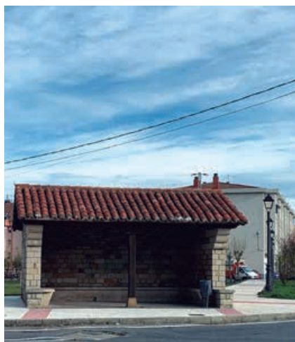
Mejora del refugio y rehabilitación de aceras en Matamorosa

La plantilla municipal comenzó a mediados de verano la rehabilitación de las aceras de la zona nueva de Matamorosa. La obra se ha extendido desde la zona situada en la calle Real, frente a la farmacia, prolongándose por la calle Julióbriga hasta la zona de la plaza.