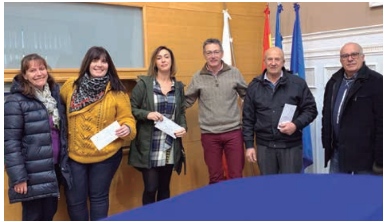
Entrega de premios del I Concurso de Belenes

En cuanto al jurado, estuvo formado por la Concejal de Turismo y dos asociaciones designadas por sorteo entre las que no se han presentado a concurso.