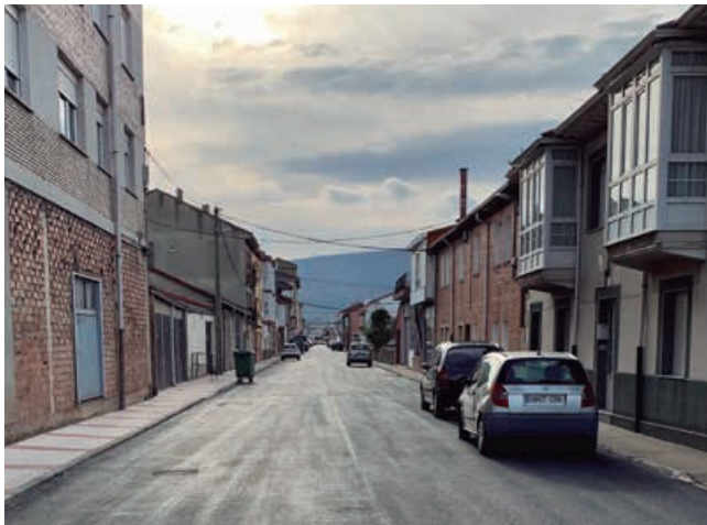
Asfaltado de una de las calles de Matamorosa afectada por las riadas

Otra de las actuaciones se centró en un pequeño acceso a la zona industrial de Los Páramos, donde existe una zona que se encontraba formada por un firme de zahorras en mal estado. En este punto se hizo precisa la preparación de la plataforma con material granular, debido a su estado general, antes de proceder al asfaltado. El año pasado ya se solucionó en el mismo entorno el acceso a otras naves con el mismo problema, también destinadas a la actividad industrial.