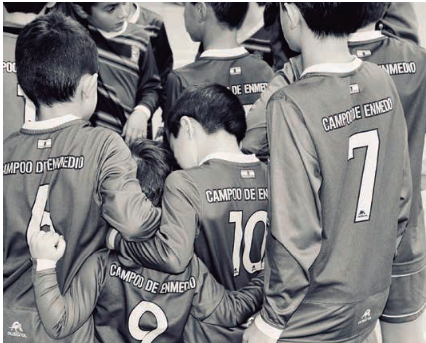
Los peques de uno de los equipos de fútbol sala