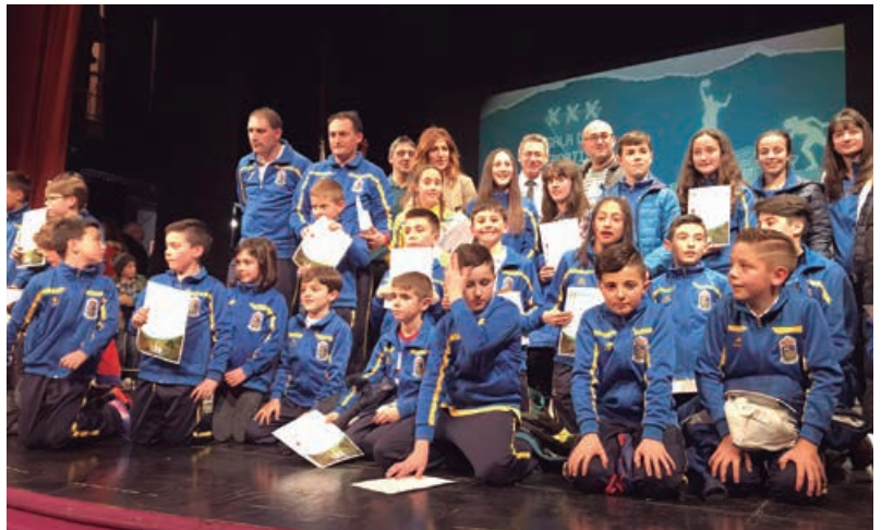
Reconocimiento a las escuelas deportivas en la Gala del Deporte Campurriano