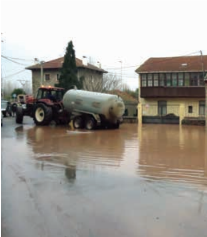
Labores de achique de agua y limpieza por parte del Ayuntamiento.

por encima de las protecciones a las cosas está la seguridad de las personas, en esta ocasión, tuvimos mucha suerte, y no tenemos que lamentar víctimas mortales, entre otras circunstancias, gracias a la hora en que aconteció el suceso y a la rapidez de reacción de numerosos vecinos. Pero a la suerte no conviene tentarla o no debería de tentarse más veces.