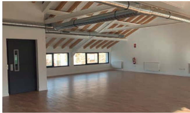
Una de las partidas de inversión ha supuesto la rehabilitación de la Casa de los Camineros