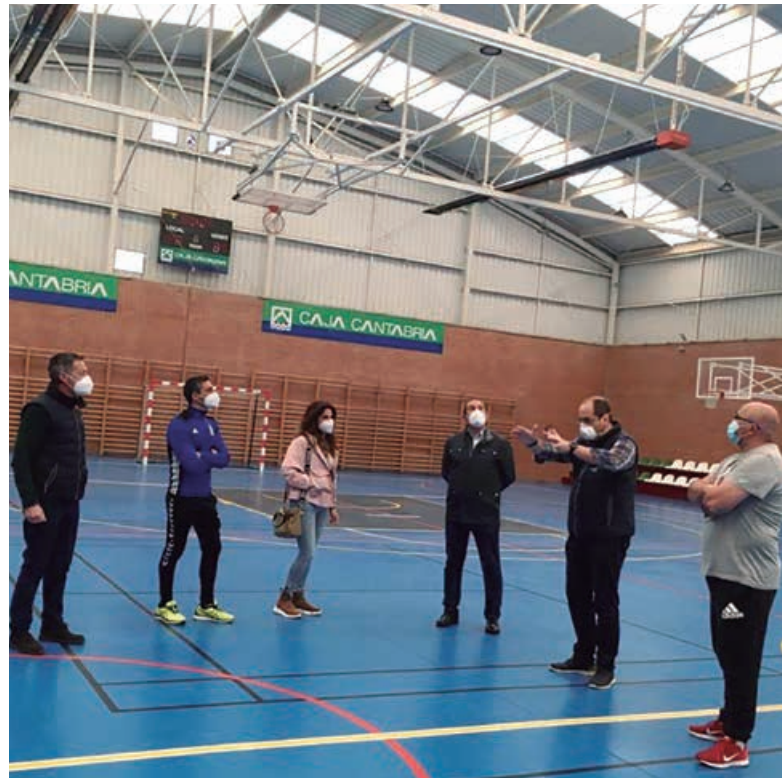
Recepción de las obras de calefacción