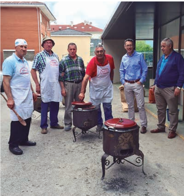
Chefs de la Asociación de Vecinos de Nestares cocinando las ollas